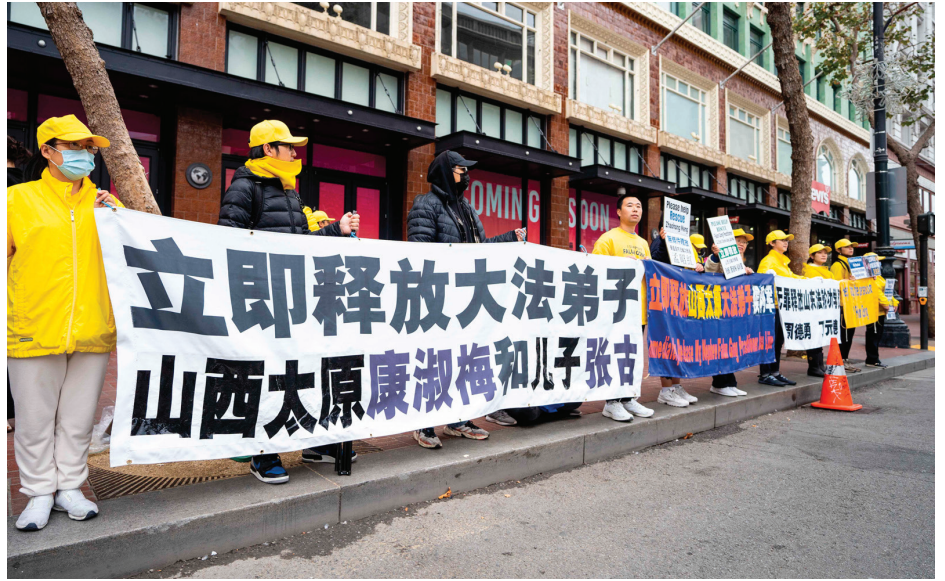
■ 法轮功学员在 APEC 峰会会场莫斯康尼中心外和平请愿。

销，但众多地区只是将“610 办公室”更名为“维稳办公室”，然后延续迫害政策，继续对法轮功学员非法判刑、监禁，对年轻健康的法轮功学员活摘器官，这些人员和罪行至今没有被根除与彻查。