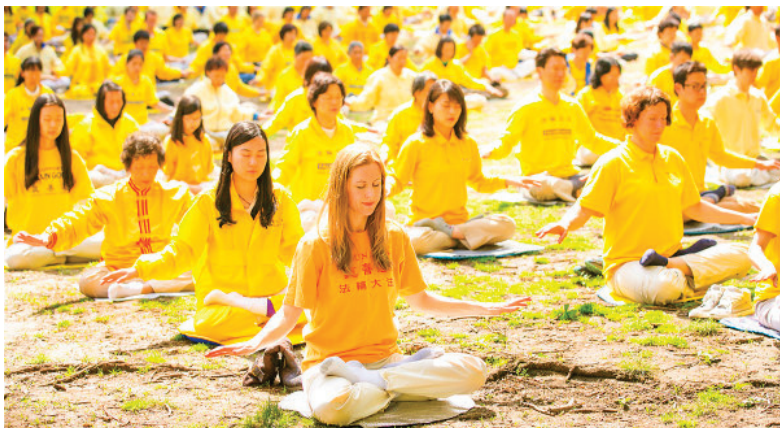
■ 法轮功是一种佛家气功，使许多人身心受益。

就这样，我戒了烟酒。而这两样东西，都是伴随我多年的嗜好。即使在我生病期间，医生告诫我，吸烟喝酒对我的身体是非常有害的，