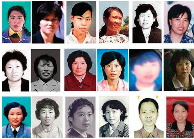
■ 部分被辽宁女子监狱迫害致死的法轮功学员

【明慧网】辽宁省女子监狱（前身是沈阳大北监狱女子监狱），位于辽宁省沈阳市于洪区平罗镇。自1999年7月20日至今，在中共江泽民政治流氓集团对法轮功学员实施“打死白打死，打死算自杀，不查身源，直接火化”的灭绝