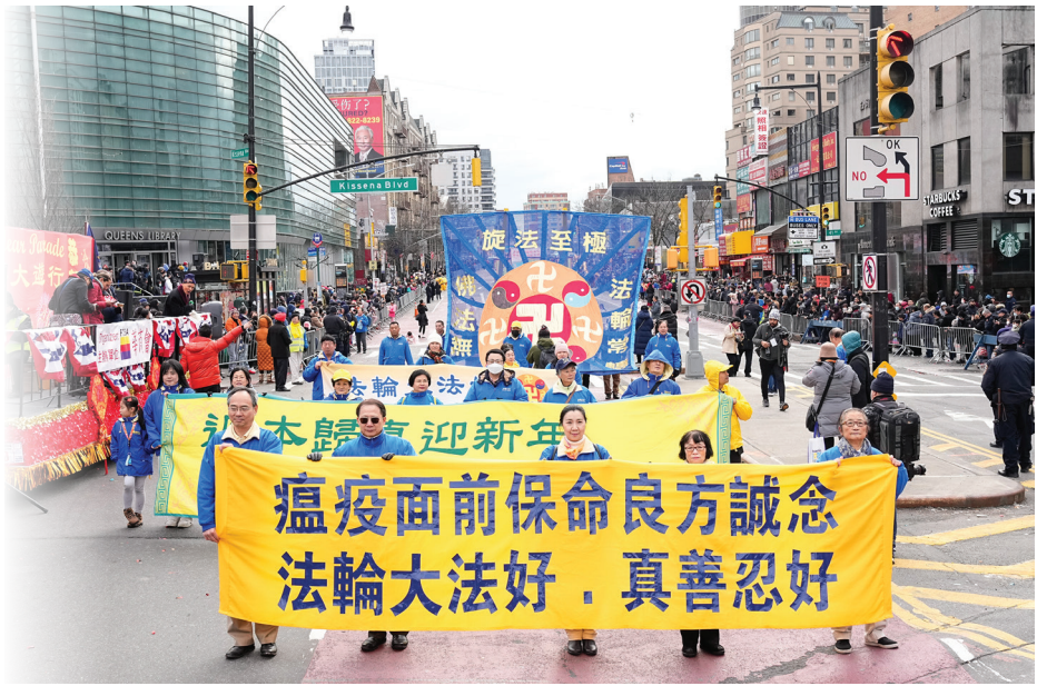
■ 2023年1月21日，法轮功学员参加纽约法拉盛新年游行。

【明慧网】少年时我非常喜爱法国经典喜剧片《虎口脱险》，每当收音机播放该片录音时，我都是忠实的听众，并把自己置身于那一场场既惊险紧张又幽默滑稽的生死追逐中。我喜欢影片中的每一个善良人，他们都尽力地帮助被纳粹追捕的英国人脱离虎口。