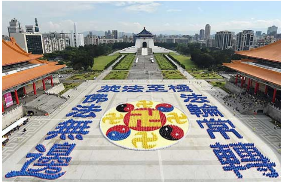
▲ 2023年12月9日，约五千两百名法轮功学员在台北自由广场排出耀眼的法轮图形和“法轮大法好 法轮常转 佛法无边”