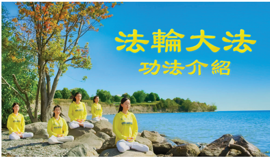
■《新世纪影视》剧组推出法轮大法功法介绍。

这是多年来都难以纠正的。现在儿子身体挺拔了，肩不痛了，人变得平和，眼睛也明亮了。