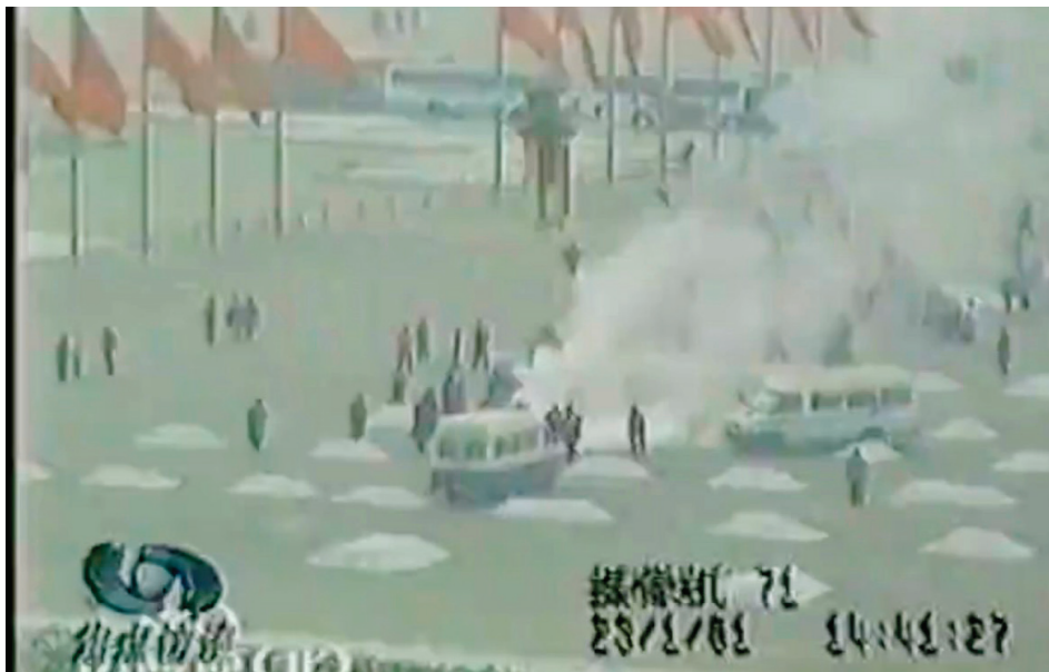
■ 央视报道天安门“自焚”事件的视频截图

镜头语言说白了就是用镜头讲故事。导演和摄影师通过一系列的画面向观众讲述一个故事。而通过这些精心设计