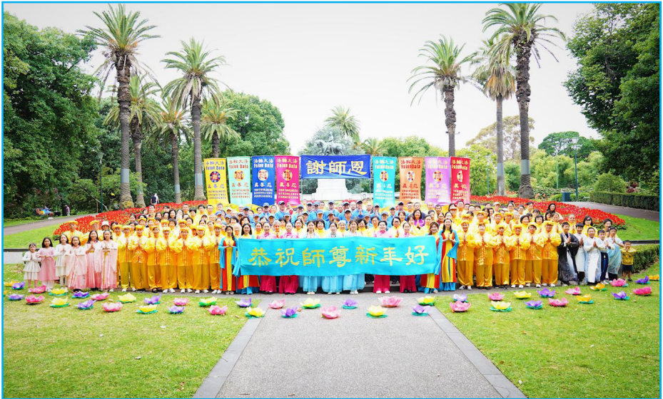
图：澳洲墨尔本法轮功学员恭祝师父新年好。