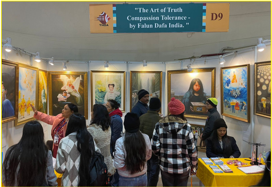
图：印度法轮大法学员一月十九日至一月二十一日参加在首都德里的普拉加蒂·迈丹 (Pragati Maidan) 会展中心举办的 HAAT 艺术展 (HAAT of ART)，展出了学员制作的真善忍美展的部份收藏作品。