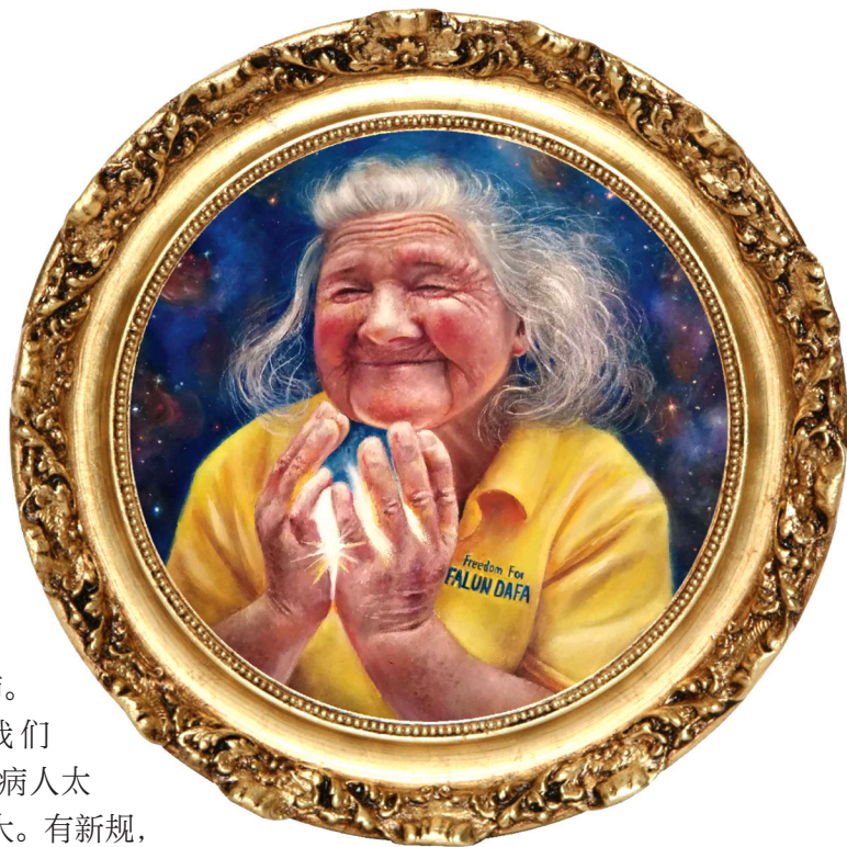
▲ 油画：《慈悲之光》作者：塞浦路斯大法弟子 Ioanna Kalogirou