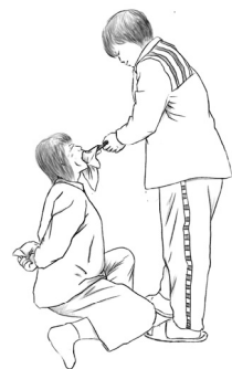
▲ 酷刑示意图：在狱警的指使下，犯人用鞋刷捣抹布堵法轮功学员的嘴。

血，腿流血，肋骨被摔断两根，突发心脏病，当时昏死过去，被送到监狱医院抢救治疗一个多月。还有一位招远市法轮功学员，因炼功被打断一根肋骨，腿被踢得好几天不能动。