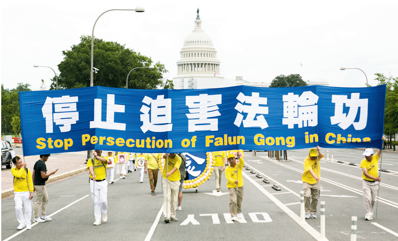
海外法輪功學員舉行遊行，呼籲制止中共迫害法輪功。