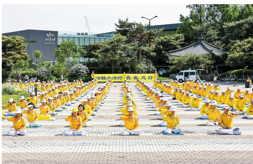
■韓國首爾大法弟子在青瓦台前煉功慶祝世界法輪大法日並恭祝李洪志師父生日快樂。

崔京洵修煉法輪大法已十餘年。她說：「以前我總是想爭取些甚麼，對利益抓住不放，過得疲憊不堪。但按《轉法輪》(法