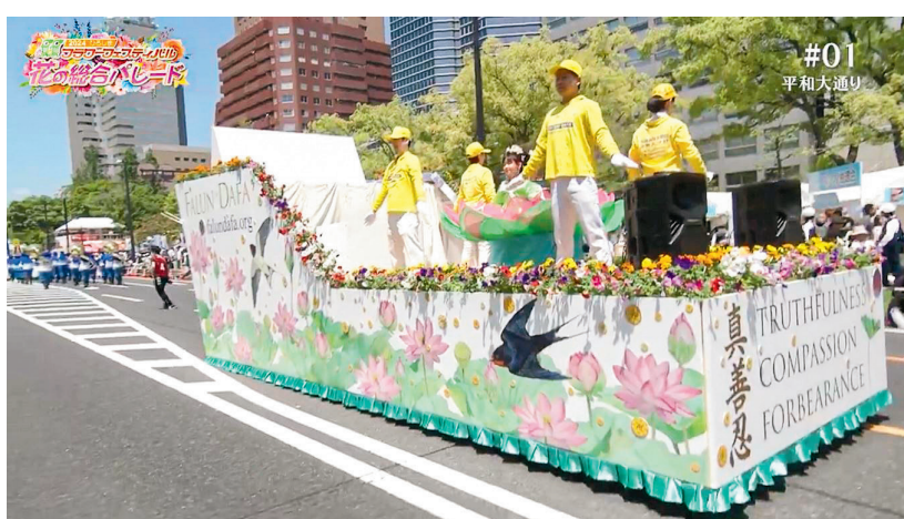
■廣島RCC電視台在視頻回放中，大篇幅保留了法輪功遊行隊伍的鏡頭(視頻截圖)。

天國樂團的演奏樂聲一起，就吸引了兩旁觀眾拍照、錄像。與此同時主辦方通過廣播介紹了法輪大法。廣島