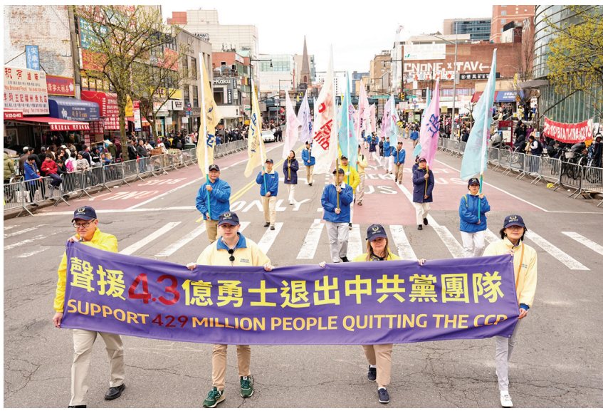
■ 2024年4月21日，紐約法輪功學員在華人社區區法拉盛舉行盛大遊行，呼籲世界共同制止中共迫害，聲援4.3億中國人退出中共黨團隊。

這時，綠燈亮了，他沒有催我走，我繼續說：「上樑不正下樑歪。現在的朝廷腐敗遭天譴，當權者們吃的都是特供，我們老百姓吃的、喝的都是有毒的