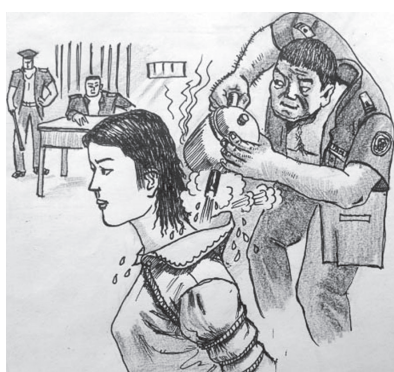
■ 中共酷刑示意圖：熱水燙。

二零二零年七月一日早上七點左右，南昌市西湖區刑偵大隊與國保大隊十餘人突然闖入喻芳莊老人家中，搶走法輪功師父