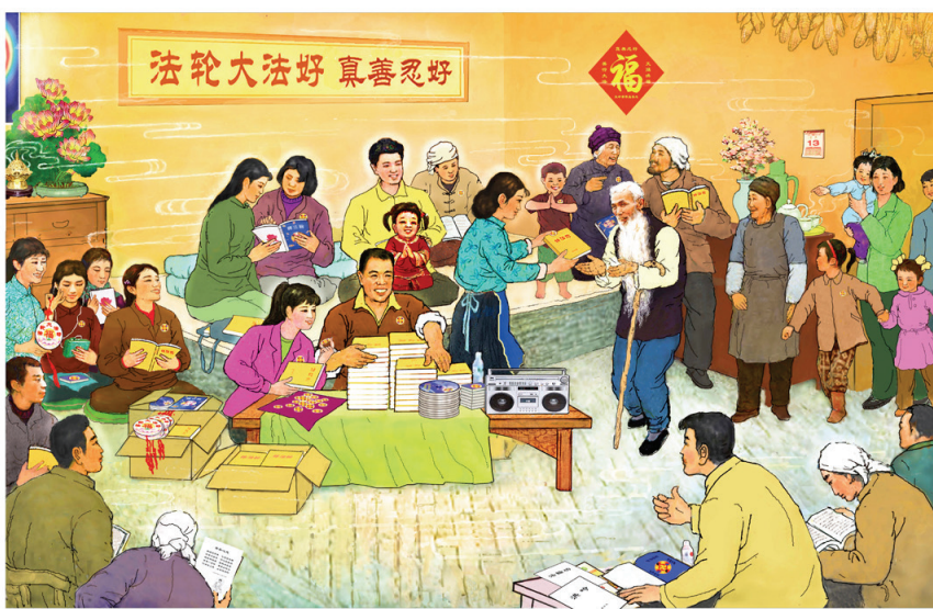
■繪畫：《大法寶書到咱村》。

在城裡上班的兒子找到在醫院當副院長的朋友，給我做了全身檢查。這位醫生朋友對我兒子說：「你媽全身都是慢性病，治這個病引發那個