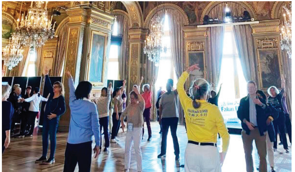
■ 法轮功学员在论坛现场向民众介绍、展示和教授法轮功的五套功法。

优美祥和的法轮功功法与音乐吸引了参加论坛的人们驻足观看，很多人当即就开始在现场学炼五套功法。在现场教功的法轮功学员神奇地发现，学炼功法的人们动作非常标准，一教就能做到位，而且第二套功法——法轮功桩法，需要站桩时间，对第一次尝试站桩的人来说，有些人会感到困难，但很多老人居