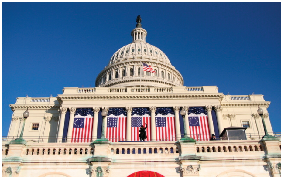
■ 2024 年 6 月 25 日，美国国会众议院全体通过《法轮功保护法案》。

是美国国会首次作出具有约束力的承诺，对迫害和活摘法轮功学员器官的行为采取强有力的法律行动，使法轮功成为立法和行动的核心。《法轮功保护法案》对那些参与或协助中共活摘器官的人实施制裁。”