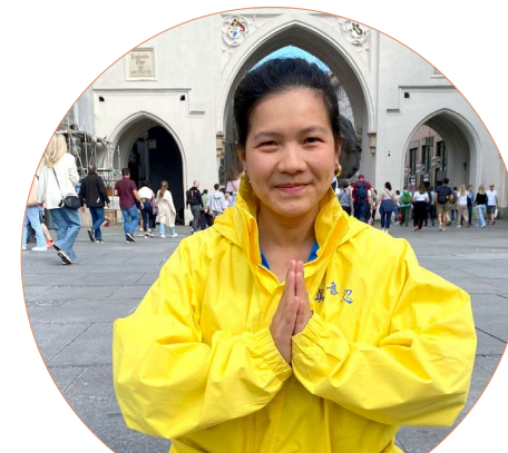
德国越南裔学员 安

哈拉莱表示，“对师父的感激之心难以言表，没有师父，没有大法，我无法得到内心的平静。我感到很幸运。”