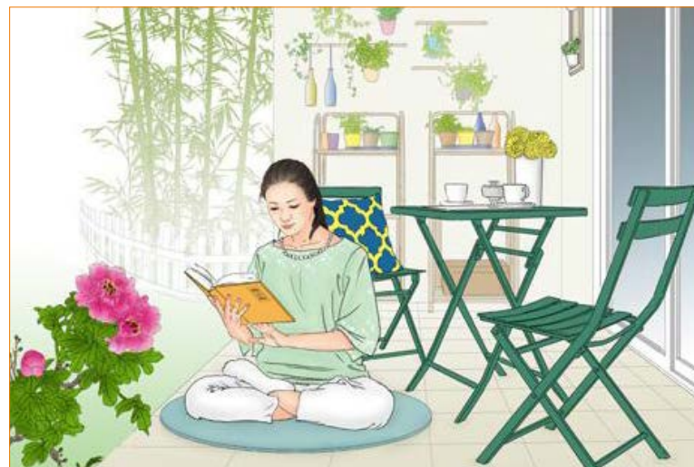
▲ 学炼法轮功后，给自己带来身心健康的希望。

书籍、炼功音乐和师父教功录像U盘，去了她家。我当场教会了她法轮功的五套功法，又叮嘱她要多看法轮大法的书。