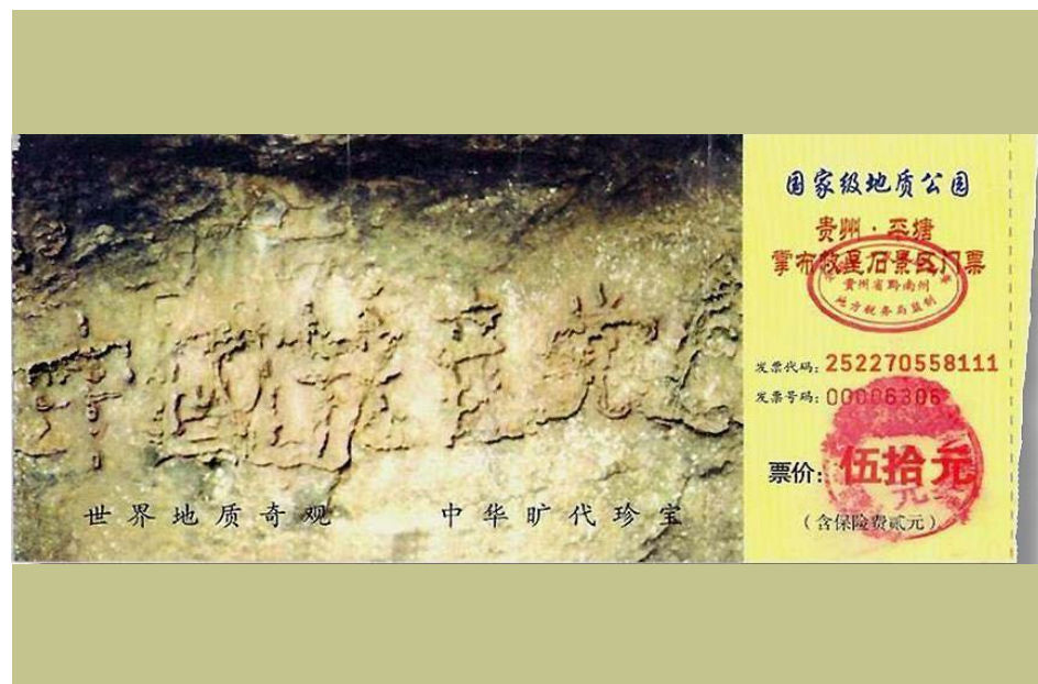
▲ 贵州省平塘县发现了一块巨石，照片印在“藏字石”景区门票上。

“君子不立危墙之下，识时务者为俊杰。”每个人都有自己选择的权利。现在越来越多的公检法人员的正义良知正在觉醒，选择了在自己能力范围之内保护法轮功学员，在历史巨变的关头为自己和亲人选择了光明的未来。希望更多公安系统的人能了解真相，远离险恶。■