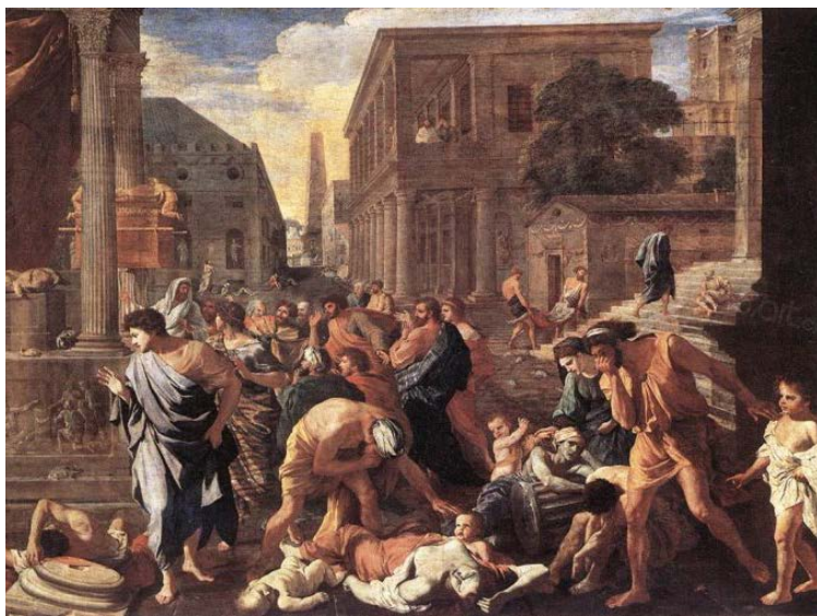
▲ 画家描绘的瘟疫 (1630 年, 法国画家 Nicolas Poussin)

基督徒不放弃信仰，就将失去财产，沦为奴隶，甚至被处死。但是大迫害之后就是大瘟疫，瘟疫四次席卷全国，瘟死了近半数人，强大的古罗马帝国也由此衰亡崩解。