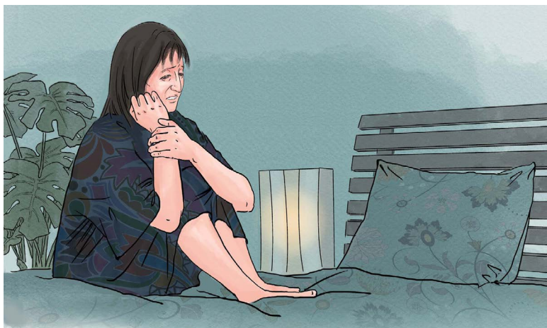
▲ 笔者朋友怎么也没想到，打了疫苗让自己身体变糟。