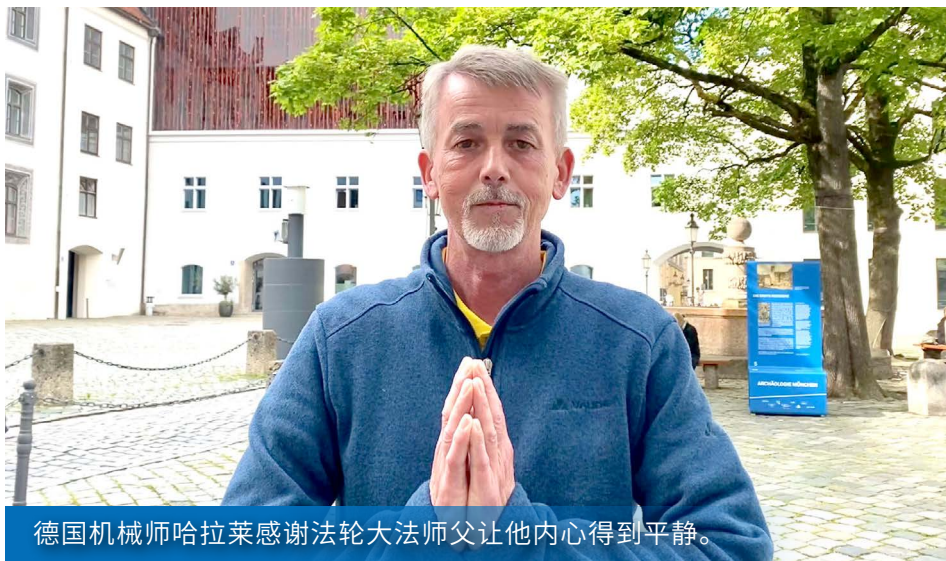
德国机械师哈拉莱感谢法轮大法师父让他内心得到平静。