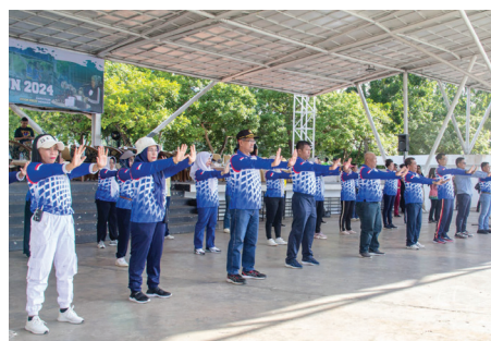
健康节组委会成员和部分市政府官员学炼法轮功。