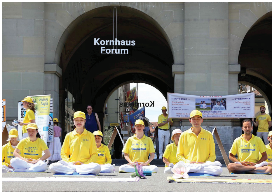
■ 法轮大法功法演示让人感受到平静祥和。

广场一侧，还有法轮功学员在演讲，为的是让更多人知道法轮大法的美好，按照真、善、忍作个好人，身心受益，同时也希望能得到更多的