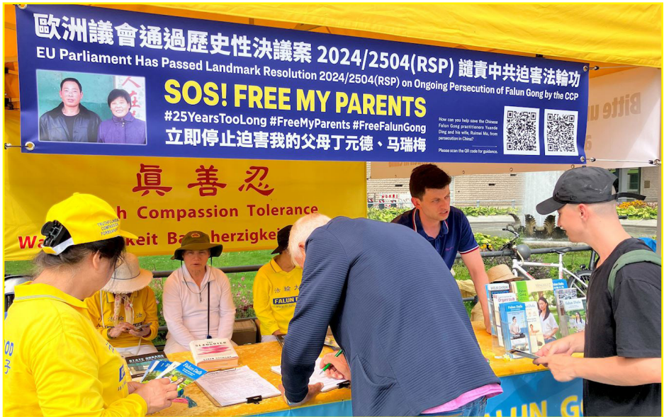
图：德国柏林部份法轮功学员八月三日来到德国著名地标之一的柏林勃兰登堡门前，向来自世界各地的游客讲述中共迫害法轮功的真相。当地法轮功学员长年的坚持，使得勃兰登堡门前的真相点成为一道独特亮丽的风景线。