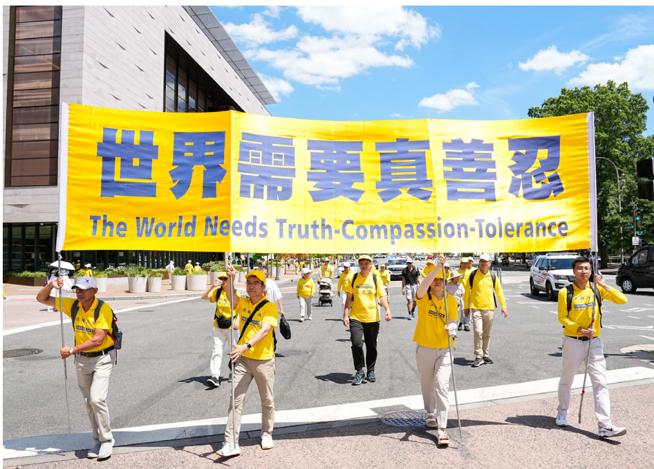
▲ 2024年7月11日，来自美国东部的法轮功学员，在“7·20”反迫害25周年将临之际，汇集在华盛顿特区游行纪念。

我听说后赶紧跑到她家。我对嫂子说：“医院不给治，咱们有更好的办法。嫂子你忘了，你81岁那年摔得腰椎骨折了，不能翻身下地。我告诉你诚念‘法轮大法好，真善忍好’九个字，让你听师父的讲法录音，你很快就好了，也没住一天医院，别人还以为你80多岁了，摔这一跤，这下可能瘫痪了，起不来了。没想到两个多月你就神奇地好了。这事你忘了吗？你怎么不念‘法轮大法好，真善忍好’呢？”