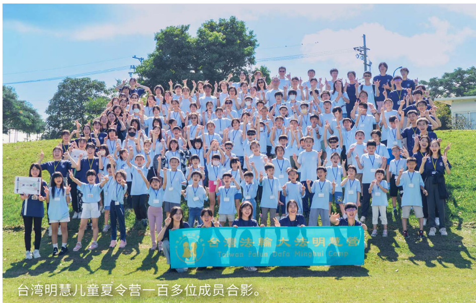
台湾明慧儿童夏令营一百多位成员合影。