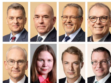
▲ 丹麦八位国会议员、候补议员及前议员联名声援。

7月20日，丹麦八位国会议员、候补议员及前议员联名声援法轮功学员反迫害，并联合签名美国“法轮功之友”发起的终止对法轮功25年迫害的联署声明书。