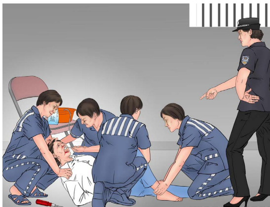
▲法轮功学员在非法拘留期间遭受折磨。

据明慧网报道统计，2022年10月至12月，有107名法轮功学员被非法判刑，669人被绑架，1221人被骚扰。