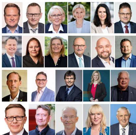
▲ 德国欧洲议员、国会议员、州议员和市议员等 22 位政要声援法轮功学员反迫害。

同时，在7月期间，20多位美国议员录制视频或发来声援信，向法轮功修炼者们针对中共暴行的和平抗争