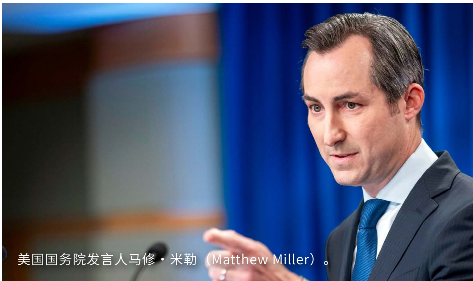
美国国务院发言人马修·米勒 (Matthew Miller)。