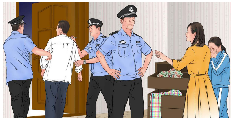
▲多名法轮功学员被绑架和骚扰。

中共政法委还利用互联网实施洗脑迫害，例如，广东省政法委挥霍190万元，伙同南方新闻网，搞了一个所谓“广东省反邪教警示教育网上基地”（注：中共是真正的邪教），散布谎言，毒害世人。■