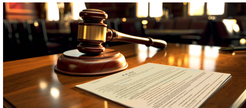
▲ 2024年6月25日，美国国会众议院通过了《法轮功保护法案》。

2024年1月，欧洲议会通过决议2024/2504 (RSP)，该决议“强烈敦促中华人民共和国（中共）立即停止对法轮功修炼者和其他少数民族，包括维吾尔族和藏族人的迫害。呼吁中华人民共和国（中共）停止在国内外的监控以及打压宗教