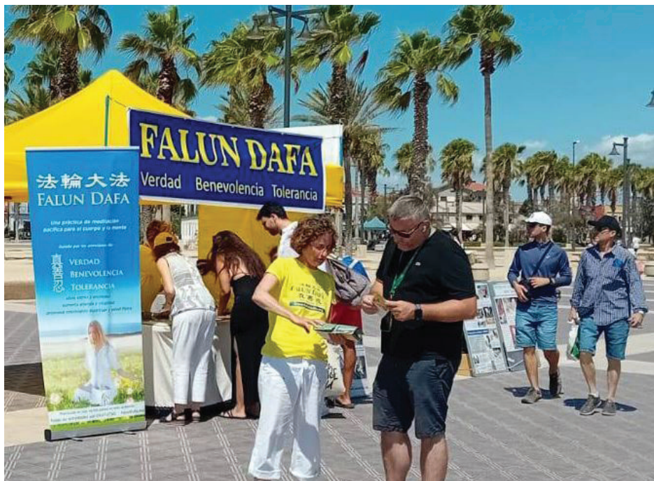
■ 西班牙法轮功学员向游客讲法轮功真相。