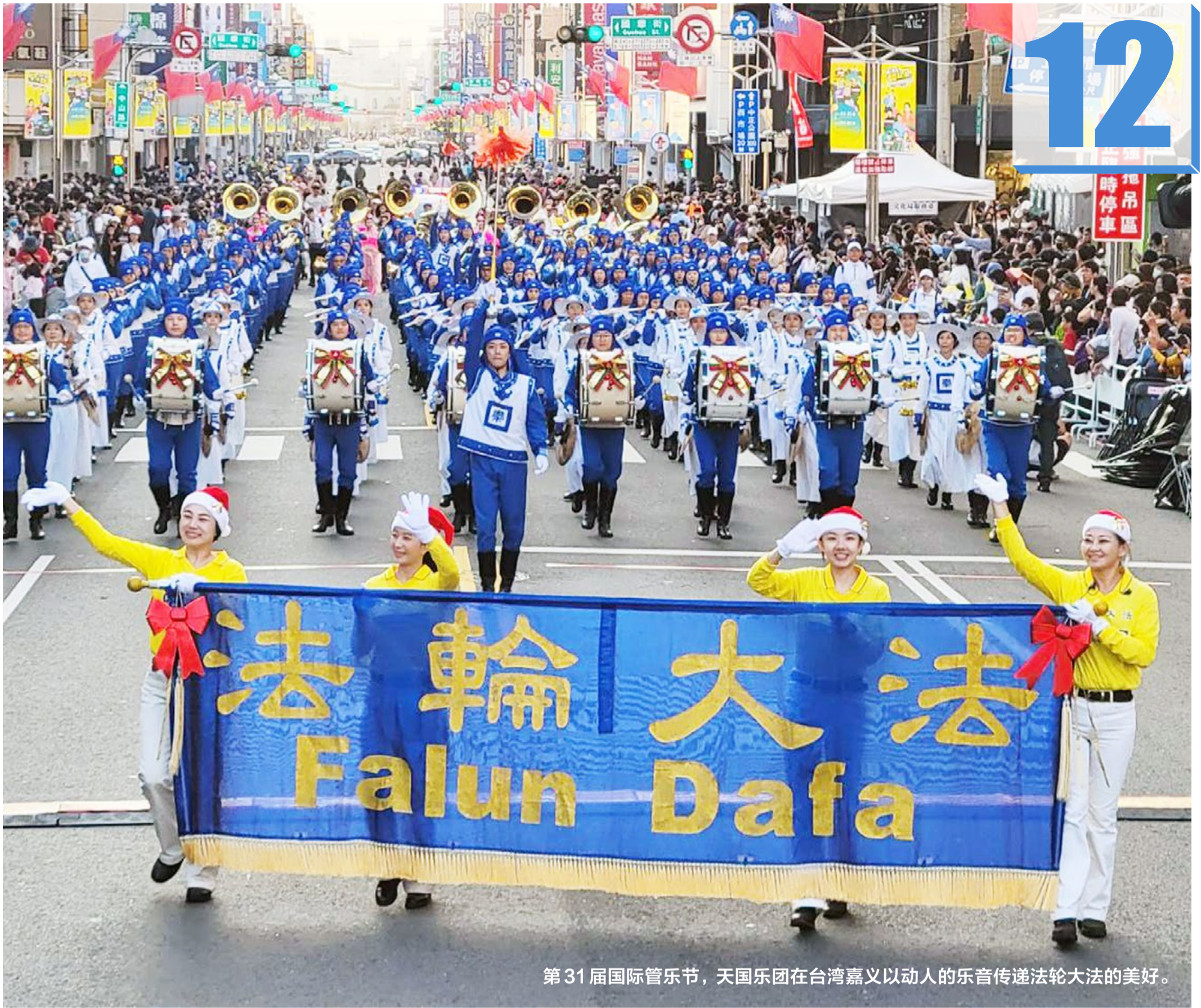
第31届国际管乐节，天国乐团在台湾嘉义以动人的乐音传递法轮大法的美好。