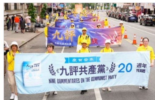
2024年7月,海外大游行,声援4.3亿中国人“三退”。

2004年11月19日,《九评共产党》问世,引发“三退”(退党团队)大潮。该书让人看清了这样的事实:中共一直用谎言与暴力迫害中国人,在历次运动中,导致8000万中国人非正常死亡。中共宣扬无神论,让人不信善恶因果,让人跟着它在各种运动中掠财害命,造下深重的罪孽而不自知。“三退”不是搞政治,是让人选择善良,不与恶党为伍,中共的恶行招致的天谴就不会落在自己身上。已有4亿多中国人“三退”。