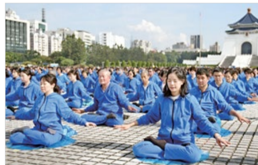
排字活动结束后，法轮功学员在自由广场集体炼功。

2023年12月9日，5200多名法轮功学员在台北自由广场举行盛大的排字活动，场面祥和壮观，吸引许多民众驻足。台湾法轮大法学会理事长萧松山教授表示，这次排出了法轮图形和“法轮常转 佛法无边”三句法轮大法的法理。其中“法轮常转”是法轮大法的特点之一。法轮常转不停，24小时都在帮助人修炼。这对忙碌的现代人而言是最方便的修炼法门，希望有缘人别失去这万古不遇的机缘。