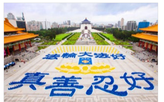
5000多名法轮功学员在台北排出“法轮大法好，真善忍好”字形。

每逢佳节，明真相的大陆民众纷纷通过明慧网感谢法轮大法师父的救度之恩。山东烟台一名九旬老伯说：“法轮大法好，真善忍好——这是我天天诚念的口诀。我因患直肠癌做了手术，为了避免化疗的痛苦，每天早饭前我就念这九个字。感谢师父护佑，我没做化疗，现在6年过去了，癌细胞全没了！熟人都夸我年轻了。我们全家人都相信法轮大法好，都做了‘三退’（退党团队）。全家人叩拜大法师父！”