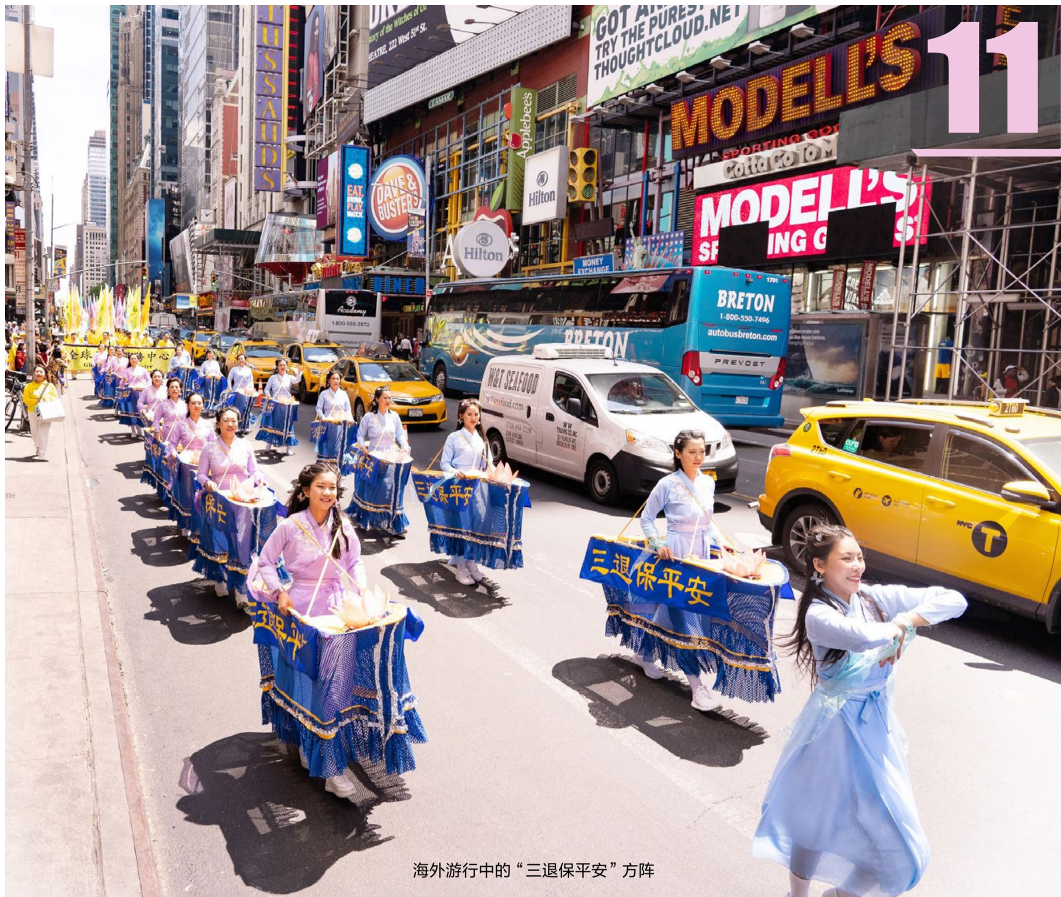
海外游行中的“三退保平安”方阵