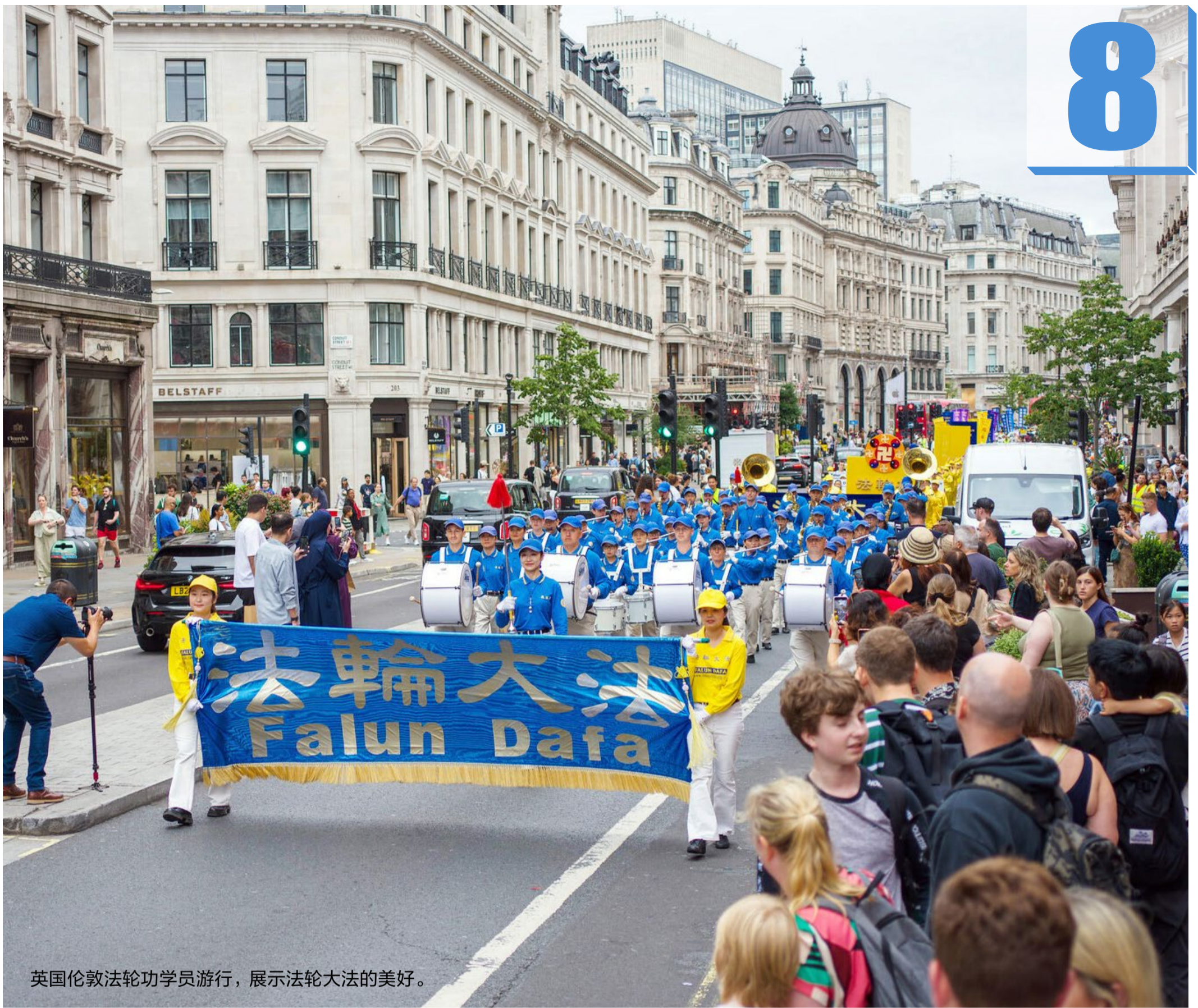
英国伦敦法轮功学员游行，展示法轮大法的美好。