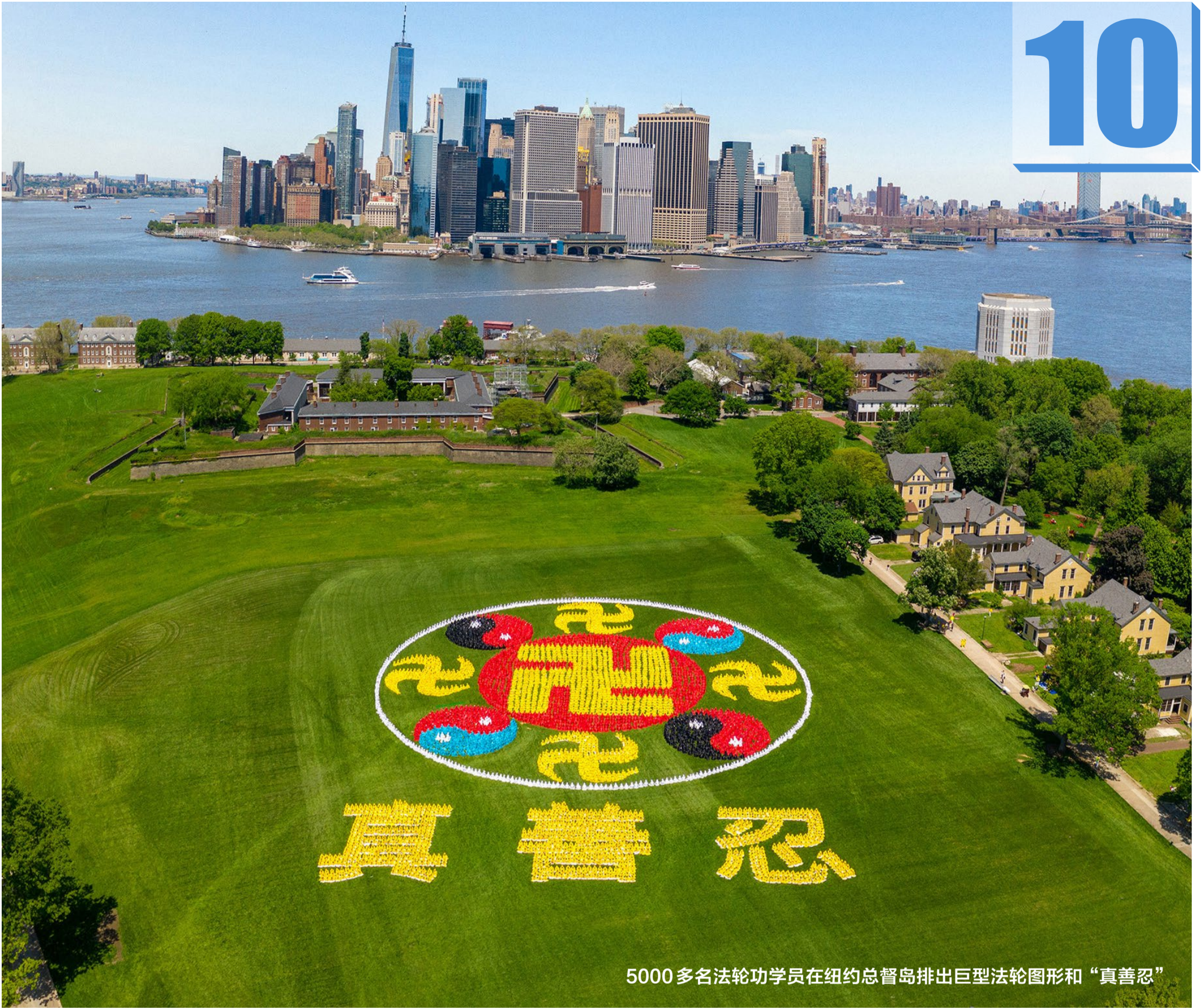
5000多名法轮功学员在纽约总督岛排出巨型法轮图形和“真善忍”