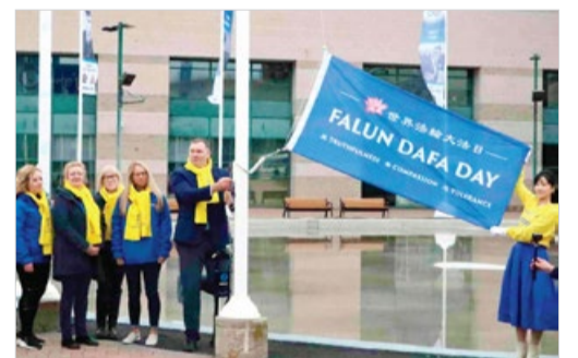
加拿大巴里市市长亚历克斯亲自升起“世界法轮大法日”旗帜。

2024年5月13日，“法轮大法好”巨型横幅在美国纽约哈德逊河上空放飞，蔚为壮观。当天是世界法轮大法日、法轮大法传世32周年，也是法轮大法创始人李洪志先生华诞。美国国会大厦上空当日升起国旗，向李洪志先生致敬。加拿大十多个城市特此举行升旗仪式。全球数百名政要褒奖法轮大法。加拿大资深国会议员朱迪·斯格罗说：“修炼法轮功的人越多，作为个体就越健全完善，我们的国家也就越强大！”