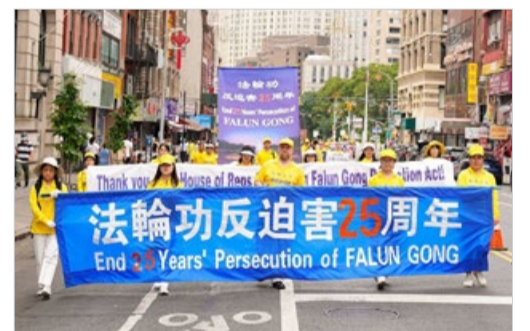
纽约游行，纪念法轮功学员和平反迫害 25 周年。

1999年7月20日，中共开始残酷迫害法轮功。25年来，法轮功学员坚守正信，捍卫人类道德，令世人感佩。2024年“7·20”当天，美国国务院发表声明，敦促中共停止迫害。15个国家的130多名议员联署，呼吁停止迫害法轮功。欧洲法轮功之友主席约翰·迪伊说：“中国的修炼者没有被残酷的迫害吓倒，中共也没能减少法轮大法对世界的积极影响。这清楚地表明迫害很快就会结束。因为一善胜百恶。”