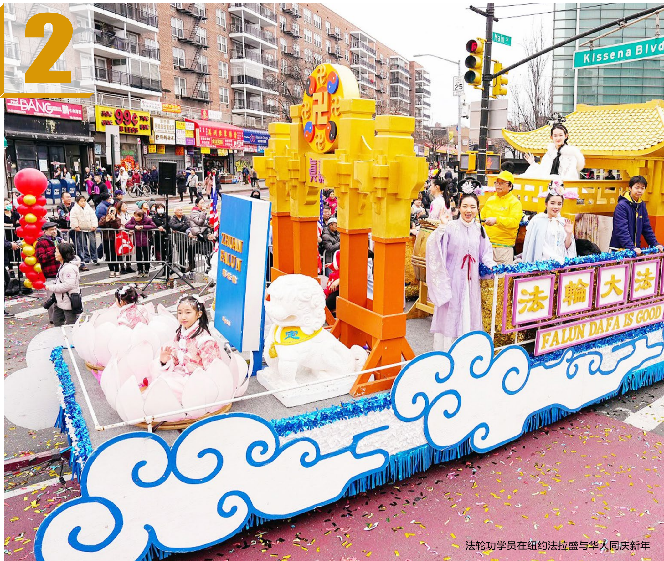
法轮功学员在纽约法拉盛与华人同庆新年