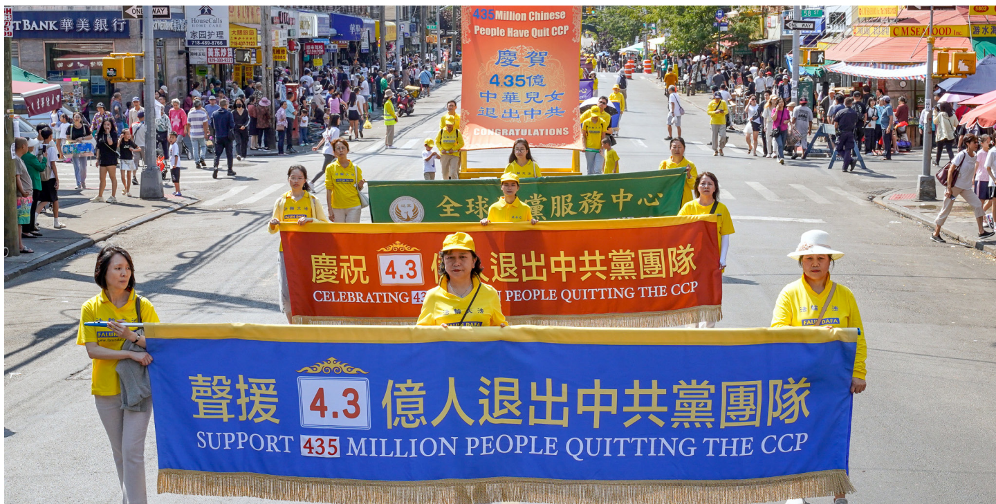
▲ 2024年9月14日，美国纽约布鲁克林大游行中，声援4.3亿中国民众退出中共的游行队伍。