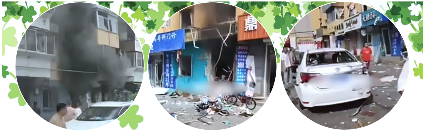
▲ 本文所诉说的爆炸后的场景