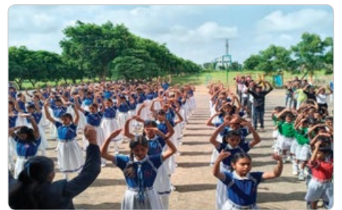
2023 年夏，印度中部 15 所学校的师生学炼法轮功，学生说炼功后思维更清晰。

法轮功弘传 100 多国，许多学校的师生学功后，都感到法轮功有益身心健康。西班牙马德里的一位老师说：“没想到平时很难安静的学生会坚持炼法轮功这么久，这很重要，现在的人过分依赖手机和电脑，变得越来越浮躁。法轮大法能让人变得平和，这正是现代社会需要的。”印度《巴斯卡尔印地文报》刊文说：“印度很多学校在教法轮功。学生学功后，成绩提高，行为明显规范。法轮功不收费，强调人要重视道德。”