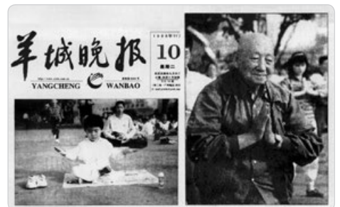
《羊城晚报》1998 年报导“老少皆炼法轮功”，并刊登了一位 93 岁老人炼功的照片。

山东烟台一名九旬老伯在 2024 年 5 月通过明慧网表达对法轮功创始人李洪志师父的感恩，他说：“法轮大法好，真善忍好——这是我天天诚念的口诀。我因患直肠癌做了手术，为了避免化疗的痛苦，每天早饭前我就念这九个字。感谢师父护佑，我没做化疗，现在 6 年过去了，癌细胞全没了！我现在满面红光，熟人都夸我年轻了。我们全家人都相信法轮大法好，都做了‘三退’（退出中共党、团、队）。全家人叩拜大法师父！”