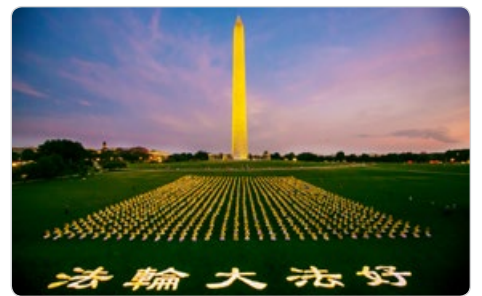
美国华盛顿纪念碑下，法轮功学员烛光集会，纪念20多年的和平反迫害历程。

1999年7月20日，中共对修炼“真、善、忍”的上亿法轮功学员发起残酷迫害。25年来，法轮功学员坚守正信，捍卫人类道德，和平理性地抵制迫害，传播真相，获全球赞誉和声援。欧洲法轮功之友主席约翰·迪伊说：“尽管面临残酷的迫害，中国的修炼者没有被吓倒，中共也没能影响或减少法轮大法对世界的积极影响，这一事实清楚地表明迫害很快就会结束。”迪伊说：“这只是一个时间问题，因为一善胜百恶。”