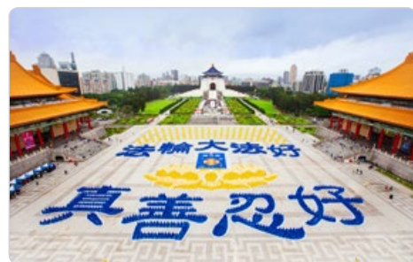
5000多名法轮功学员在台北的自由广场排出“法轮大法好，真善忍好”字形。

每逢新年，明真相、得福报的中国大陆民众都通过明慧网向法轮功创始人李洪志师父拜年并感谢法轮大法的救命之恩。一位来自李大师的家乡——吉林省长春市的市民恭祝师父新年快乐，并赋诗一首表达感恩之心：“病毒来袭太疯狂，世人为此皆惊慌。东躲西藏没办法，谁知我也变成阳。突然想起法轮功，师父能帮我的忙。我虽不是您弟子，念‘法轮大法好，真善忍好’，病毒立刻全灭光。感谢师父的救度之恩！”