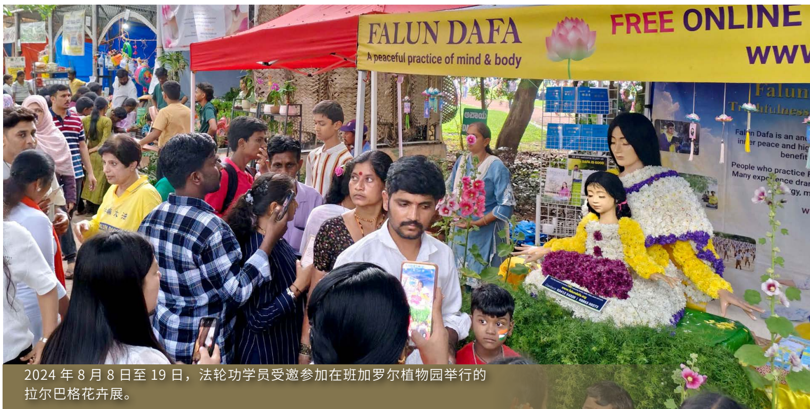
2024年8月8日至19日，法轮功学员受邀参加在班加罗尔植物园举行的拉尔巴格花卉展。