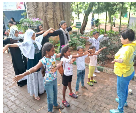
▲ 学员教感兴趣的民众学炼法轮功。 ◀ 师生们手持真相传单在法轮功展位前合影留念。

是印度议会第一个公开支持法轮功、反对中共迫害的议员。他在花卉展上赞赏法轮功学员为传播真相所做的努力，并表示自己被学员们制作的展品所吸引，他直呼：“太棒了！”