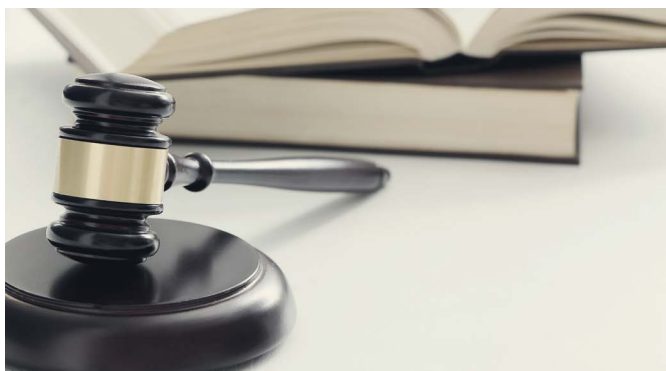
▲ 目前，美国地方法院法官纳塔利·赫特·亚当斯将李平的认罪请求提交给联邦地区法官。