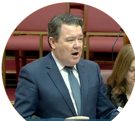
西澳自由党联邦参议员迪恩·史密斯