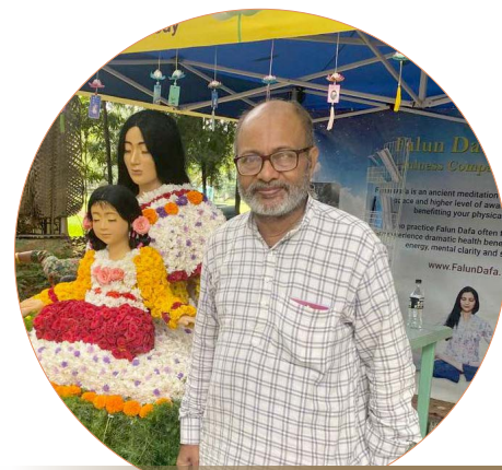
印度前议员阿内尔