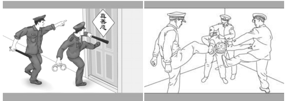
中共迫害示意图：非法抄家、殴打