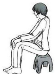
中共体罚示意图：长时间罚站、罚坐小板凳