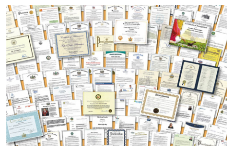
◎全世界多个国家的政要颁发褒奖或发贺信等,感恩法轮大法给民众和社会带来福祉。

每逢这个喜庆的日子,各国政要纷纷以升旗典礼或颁发褒奖等方式,赞扬李洪志先生和法轮大法对世界的重大贡献;美国国会大厦连续三届法轮大法日升起美国国旗,向李洪志先生致敬,表彰李洪志大师将法轮大法弘传世界,使各民族受益。