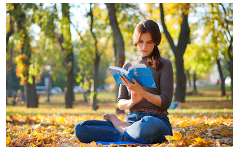
◎法轮大法弘传世界，西人结缘《转法轮》，她们由衷地说：修大法使人生变得美好。

1992年，法轮大法由李洪志先生从中国长春传出，上亿不同族裔的民众走入了大法修炼，通过阅读《转法轮》，身心受益，道德回升。李洪志先生在这部著作中阐述了法轮大法“真、善、忍”的法理，直指人心，明确修炼心性是关键，指出了往高层次修炼的大法大道。1994年12月，《转法轮》由中国广播电视出版社出版发行；1996年，被《北京日报》《北京青年报》等报纸评为十大畅销书。