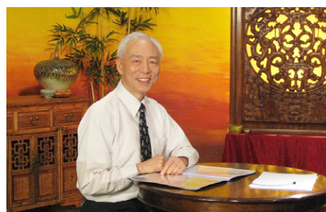
◎ 现年78岁的胡医师身体强健，鹤发童颜，被人们称为“医术医德俱佳的中医大师”。

1997年，胡医师炼了法轮功，身体健康，精神奕奕，皮肤细嫩。有人问他健康的秘诀，他说：“修炼法轮功！法轮功讲‘真、善、忍’。一个人的健康与道德水平有紧密关系。”胡医师说法轮大法给他带来那么多美好，所以他每天都心存感恩。