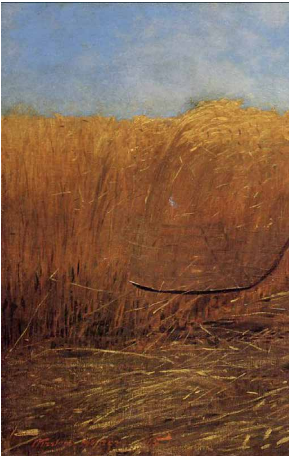
新領域的老兵 油畫 61.3×96.8 厘米 美國 溫斯洛·霍默 1865 年 大都會美術館藏