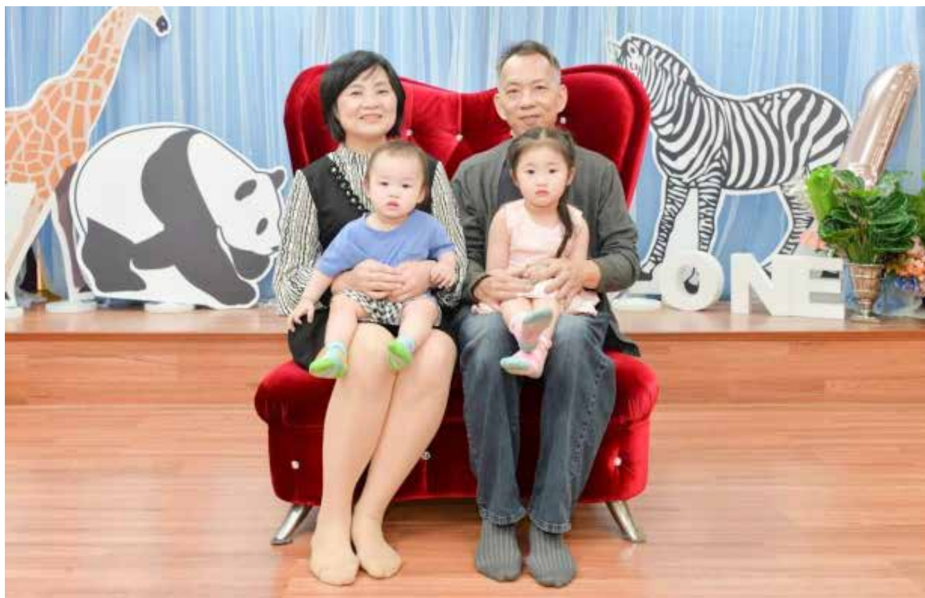
曉薇、先生與孫子孫女的合照