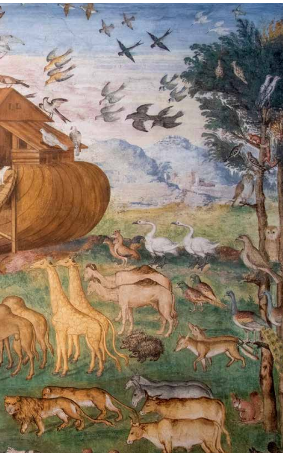
登上諾亞方舟 壁畫