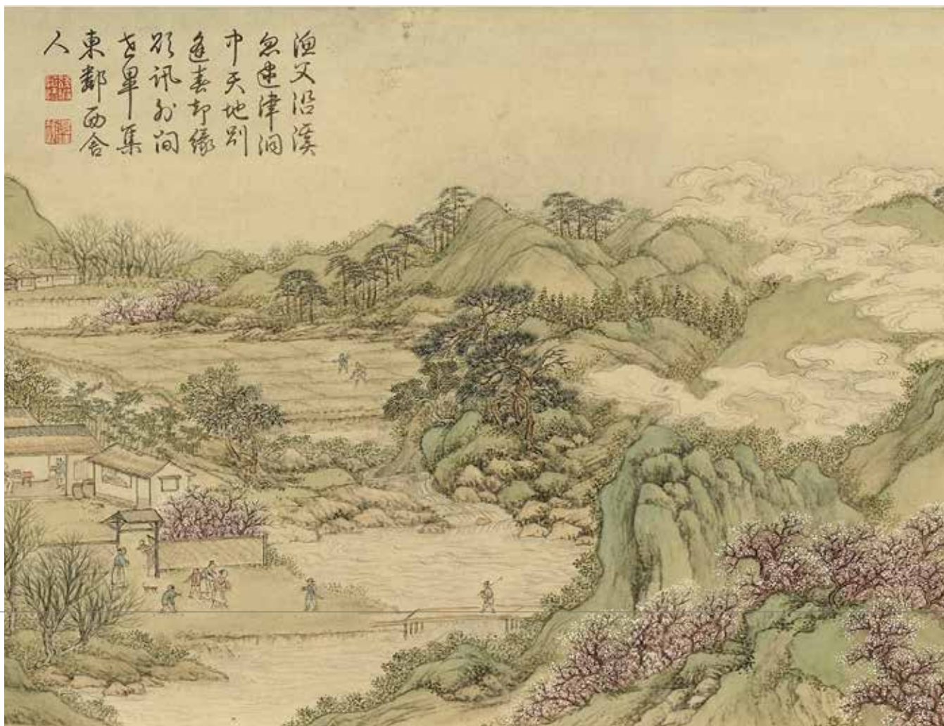
清方琮畫山水八幀 冊 桃源延客