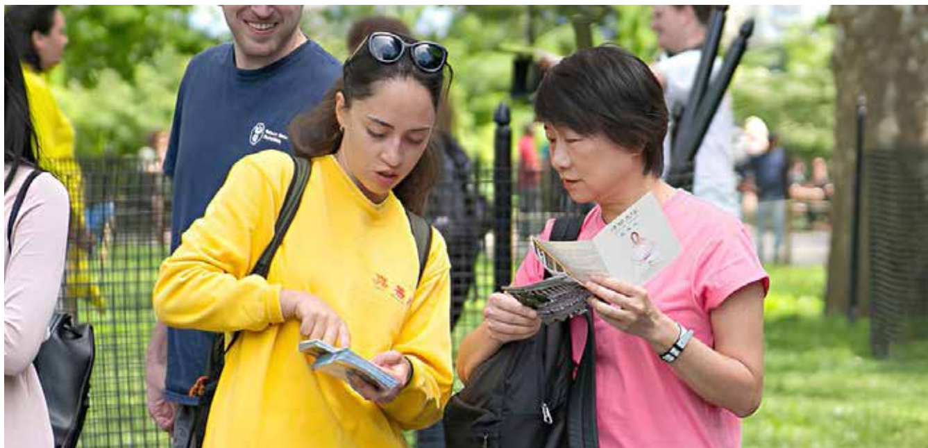
法輪功學員為民眾講述法輪功的真相

對於海外滾滾「三退」（退出共產黨、共青團、少先隊），她也有深刻的反思。以前她也不明白為什麼要「三退」。後來深入瞭解，瞭解了共產黨與天鬥、與地鬥的邪惡本性，它破壞了中華大地，摧毀了人性，摧毀了道德，摧毀了人對神佛的正信，而人信仰了這種邪惡，還不危險嗎？共產黨在綁架無辜的人們啊！遠離邪惡、避免災難，這不是政治，是在喚醒人。她說：「當然，不是所有人都認同，但在我的講真相中，很多人都認同了。」