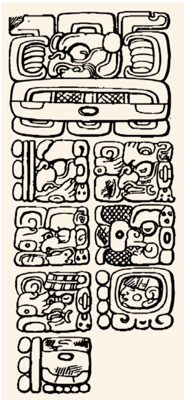
瑪雅文明留下的基里瓜石碑 C 東側的 Maya Long Count

1-3: 第三個太陽紀為里莫利亞文明，也稱「生物能文明」。他們擁有與大自然溝通的能力，注意到植物在發芽時所產生的能量，最終發明出利用植物能來釋放大量能量的機械。里莫利亞的「姆帝國」是一個至少八十萬年前發展起來的超級古文