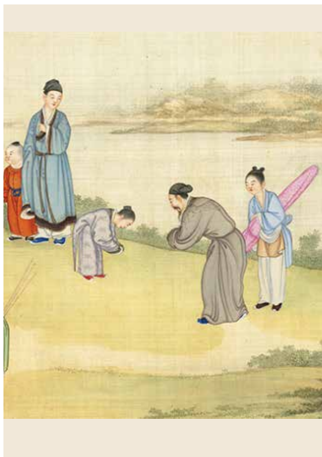
清 丁觀鵬 太平春市圖

亂世之中，不管別人是否守德，如果每個人都自己要求自己守住善良、提升品德，才能有越來越多的人成為被神眷顧的生命。