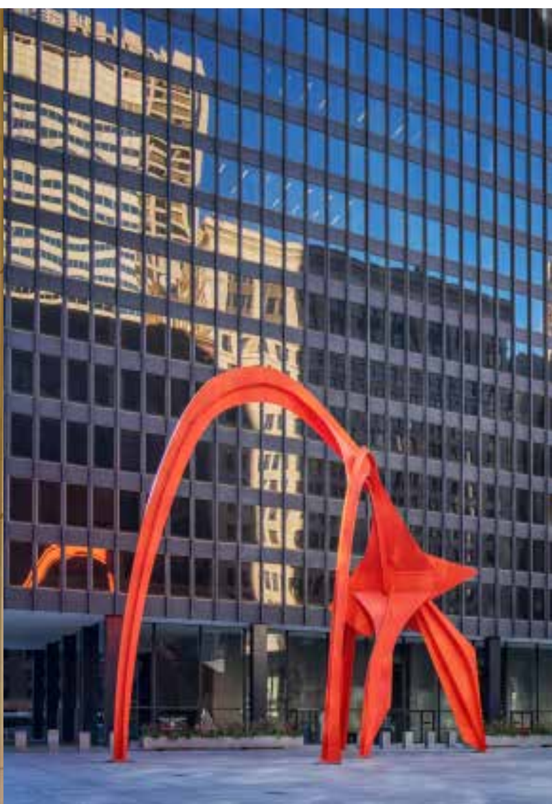
芝加哥克魯欽斯基聯邦大廈前的聯邦廣場