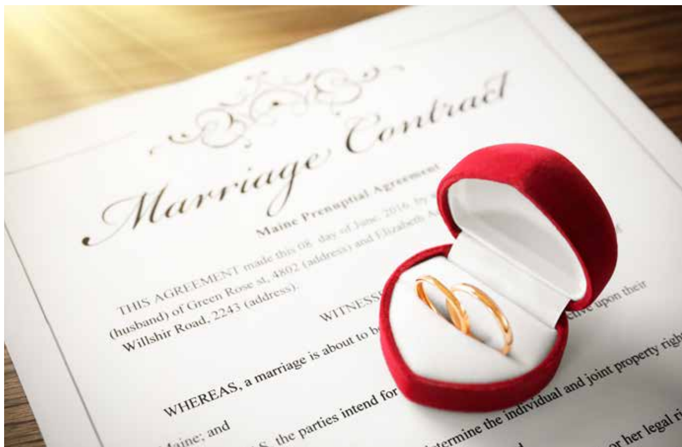
象徵承諾的結婚證書和戒指

可惜很多人已經不懂這一點了，對婚姻充滿著不切實際的幻想，最後給自己造成悲劇。英國國寶級演員費雯·麗（1913年—1967年）就是這樣一個例子。這位兩屆奧斯卡影后及威尼斯電影節最佳女主角獎得主，不但是出色的電影演員，也是優秀的舞臺劇演員。在奧斯卡頒獎禮上，評審團給她的著名評價是，「她有如此美貌，根本不必有如此演技；她有如此演技，根本不必有如此美貌。」儘管有著絕世容顏，費雯·麗在個人情感方面卻並不順遂，她沒有珍惜婚姻，而是狂熱的追求愛情，最終於53歲時在英國的家裡孤單辭世。