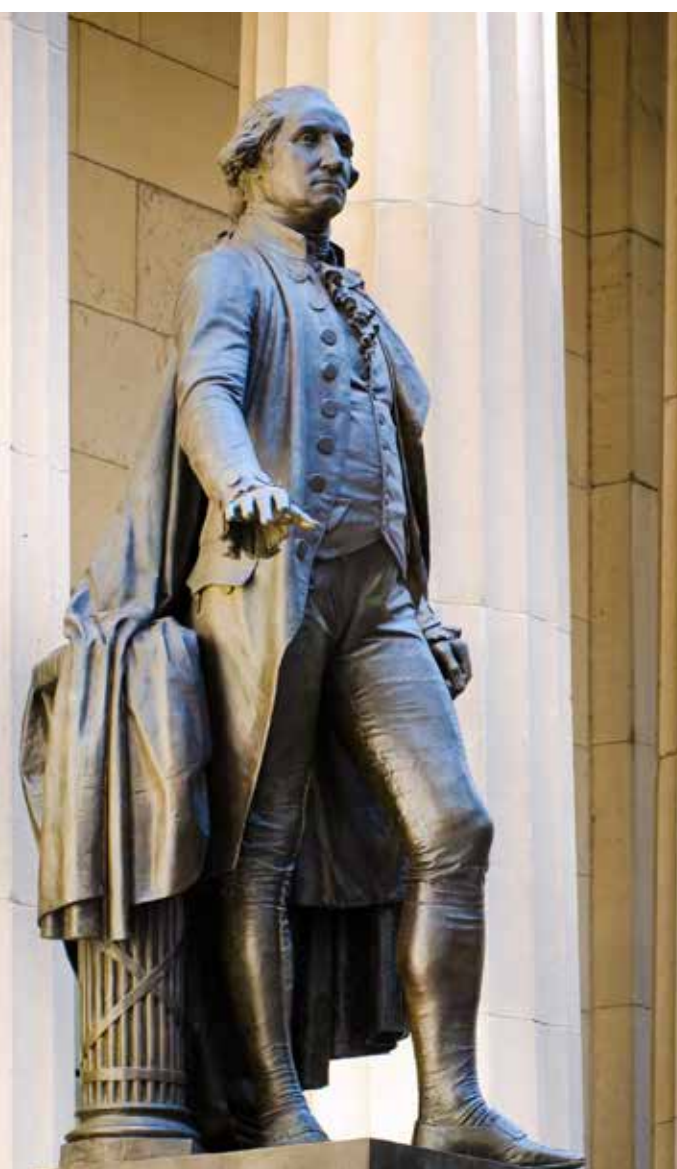
紐約市聯邦大廳內的喬治華盛頓雕像