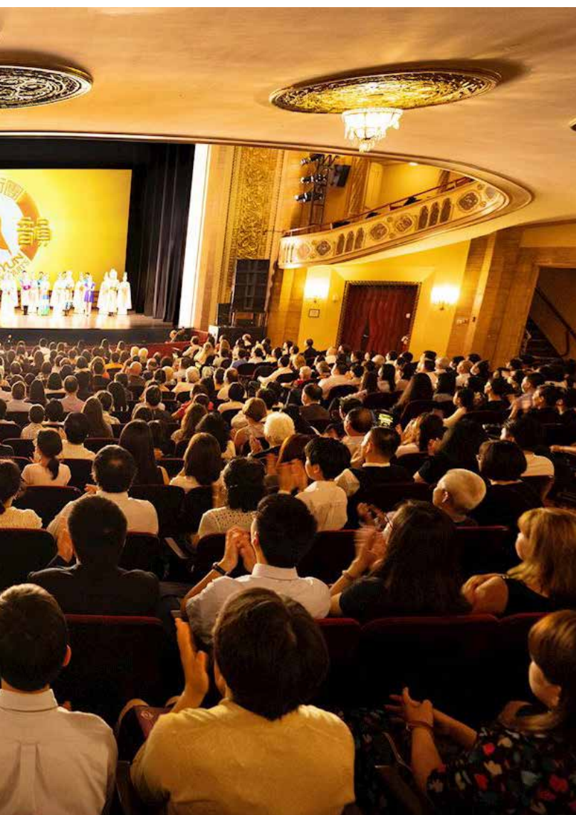
神韻藝術團全球巡迴演出

的靈異表現，經追蹤調查，發現十三個水晶頭骨竟已全部現世。當這十三個水晶頭骨全部聚齊的時候，美洲的土著人按照瑪雅人的「聖歷」舉行了一次儀式莊嚴的大集會，大祭司唐·阿萊堅德羅開啟了穿越時間的先知所留下的真言：現在就是神回來的時候！