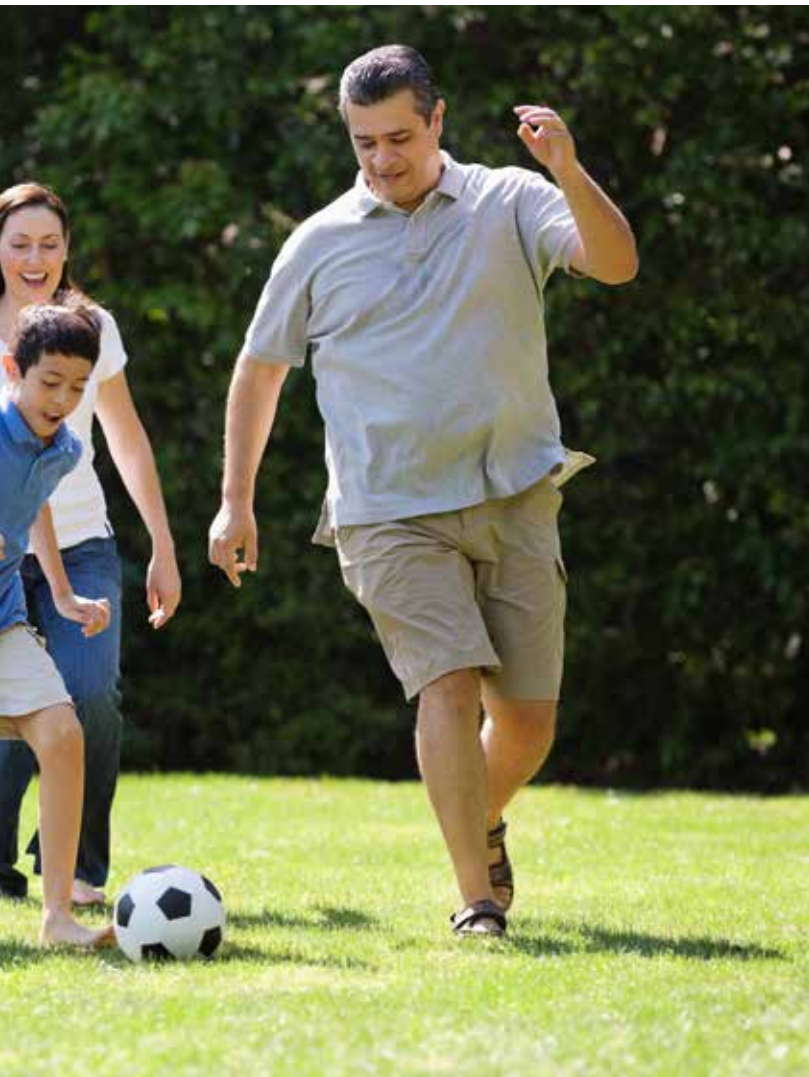
孩子和父母在公園踢足球

在各國共產黨的代表大會和重要活動上都演奏的《國際歌》充滿了謊言，是一首煽動情緒和制造仇恨的歌。歌詞里有這樣一句話：「我們要做天下的主人！」我注意到，現在有「統治世界」、「大一統」思想的大陸人、台灣人不在少數，所以有時會想：不知人們是否理性地想過，這種思想的最初來源在哪里？「英特納雄耐爾，就一定要實現」這句話，它的真實含義又和共產主義的四十五個目標有哪些關聯呢？