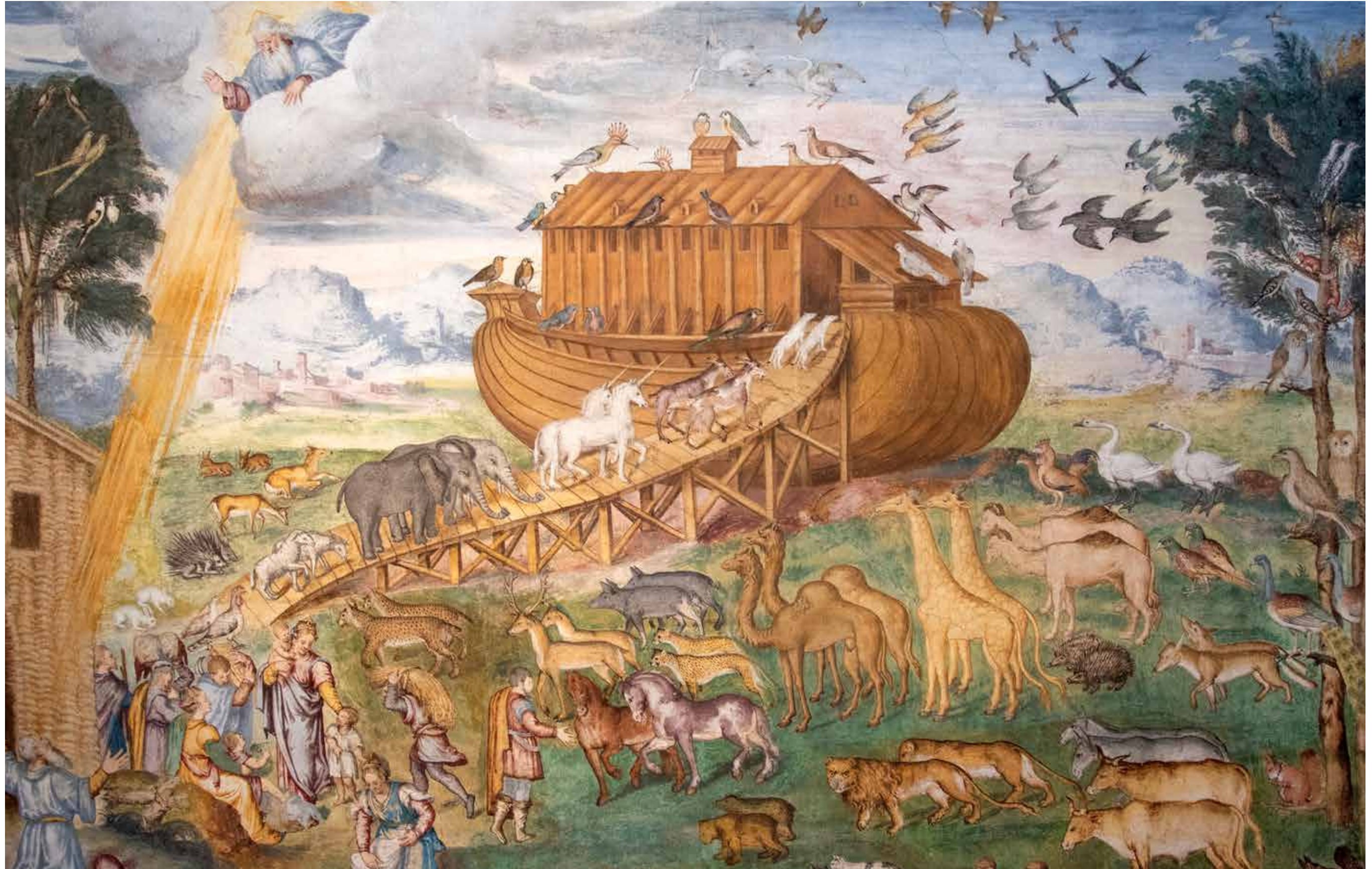
登上諾亞方舟 壁畫 [意大利] 聖毛里齊奧·阿爾·莫納斯特羅·馬焦雷教堂