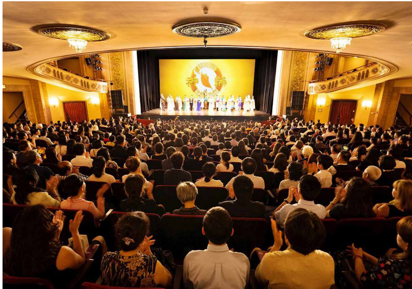
神韻藝術團全球巡迴演出