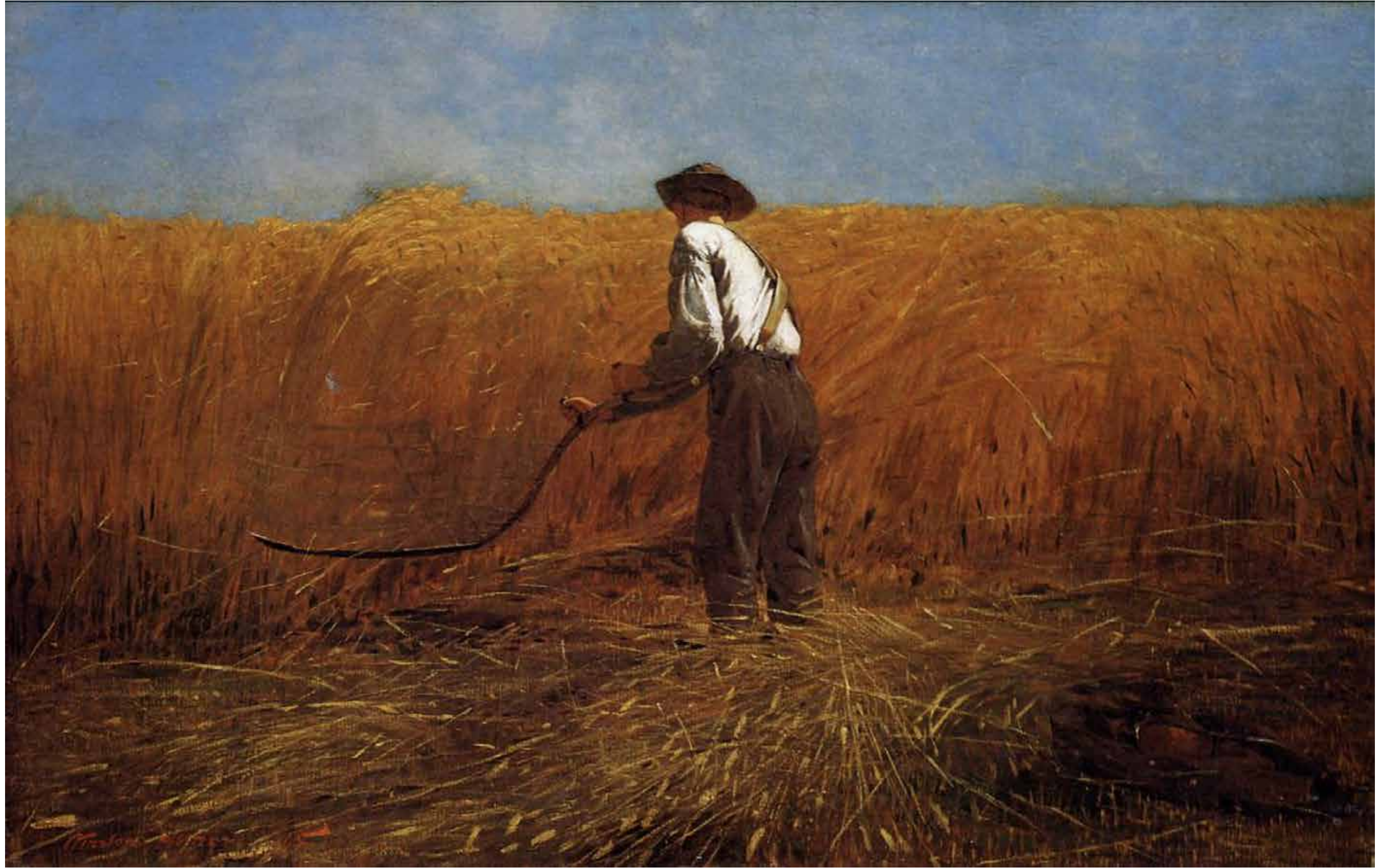
新領域的老兵 油畫 61.3×96.8 厘米 [美國] 溫斯洛·霍默 1865 年 大都會美術館藏