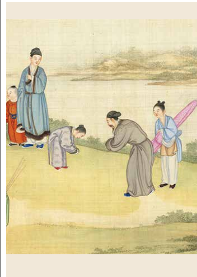
清 丁觀鵬 太平春市圖

亂世之中，不管別人是否守德，如果每個人都自己要求自己守住善良、提升品德，才能有越來越多的人成為被神眷顧的生命。