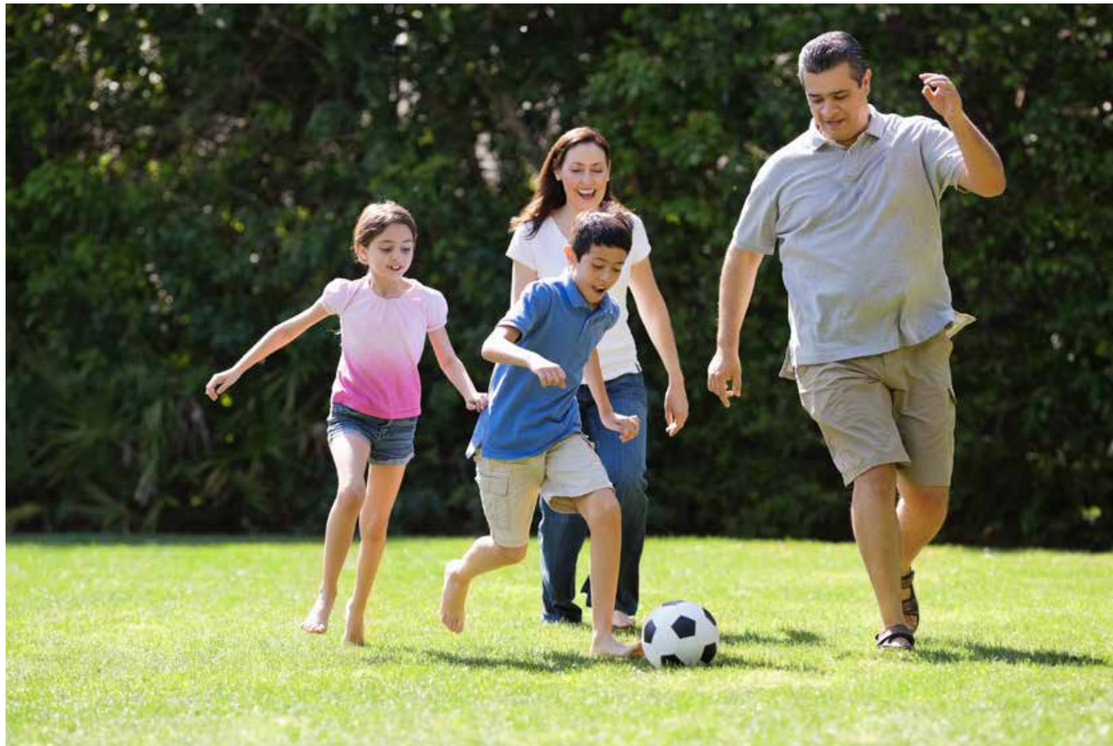
孩子和父母在公園踢足球

劃書的核心內容? 事實上, 它的確是共產黨人顛覆美國的行動計劃, 六七十年來, 已經一步一步地主導了眾多美國人的家庭生活、人際關係、學校教育、大企業經營道德, 嚴重動搖了美國一代又一代年輕人對憲法和公民意識的正確理解。