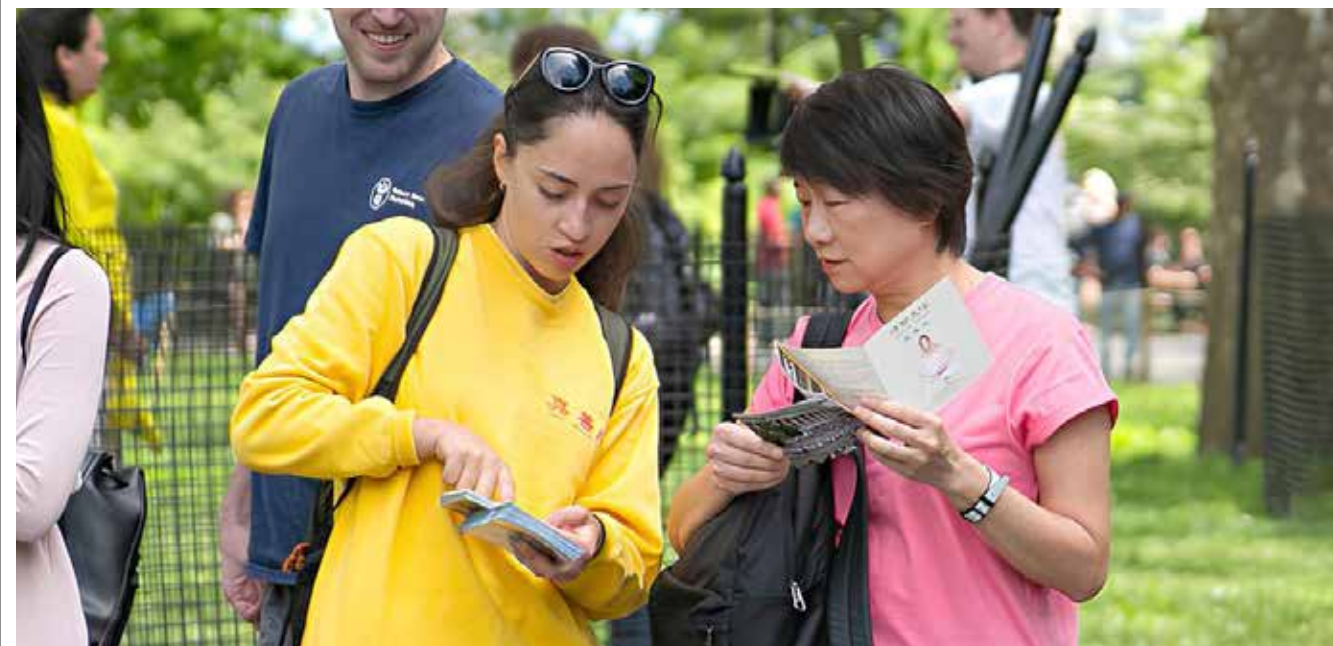
法輪功學員為民眾講述法輪功的真相

對於海外滾滾「三退」（退出共產黨、共青團、少先隊），她也有深刻的反思。以前她也不明白為什麼要「三退」。後來深入瞭解，瞭解了共產黨與天鬥、與地鬥的邪惡本性，它破壞了中華大地，摧毀了人性，摧毀了道德，摧毀了人對神佛的正信，而人信仰了這種邪惡，還不危險嗎？共產黨在綁架無辜的人們啊！遠離邪惡、避免災難，這不是政治，是在喚醒人。她說：「當然，不是所有人都認同，但在我的講真相中，很多人都認同了。」