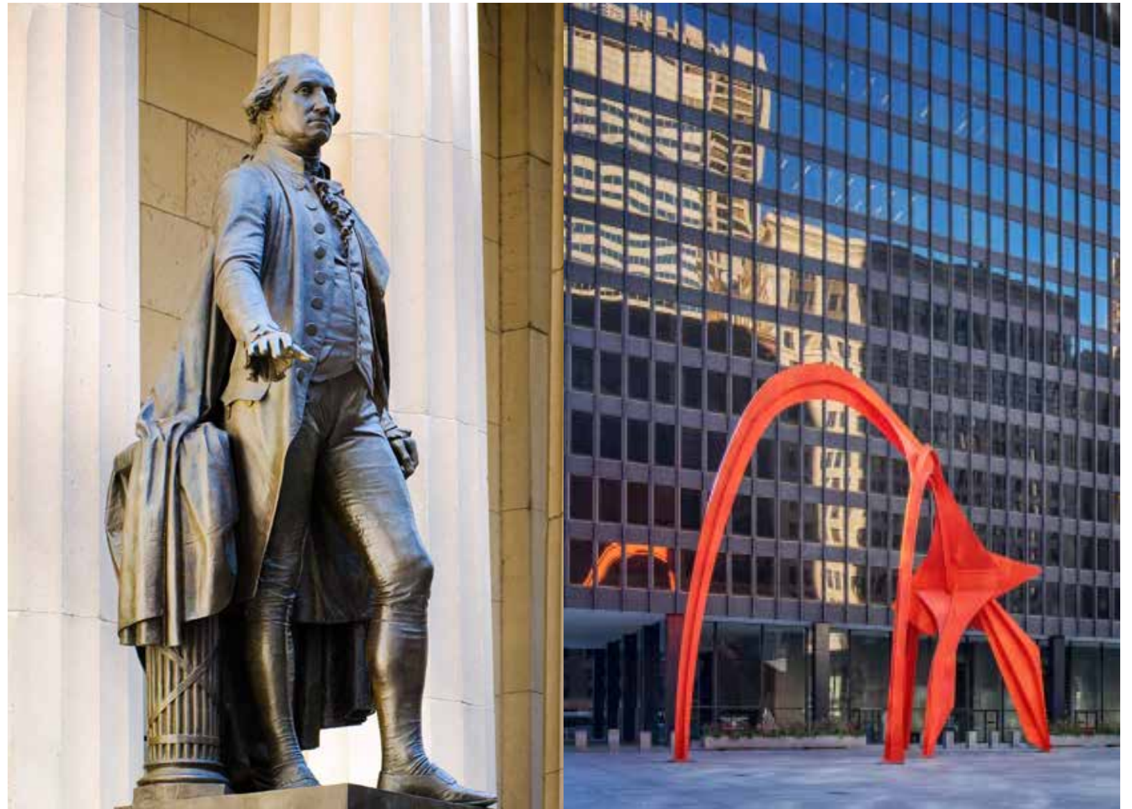
紐約市聯邦大廳內的喬治華盛頓雕像