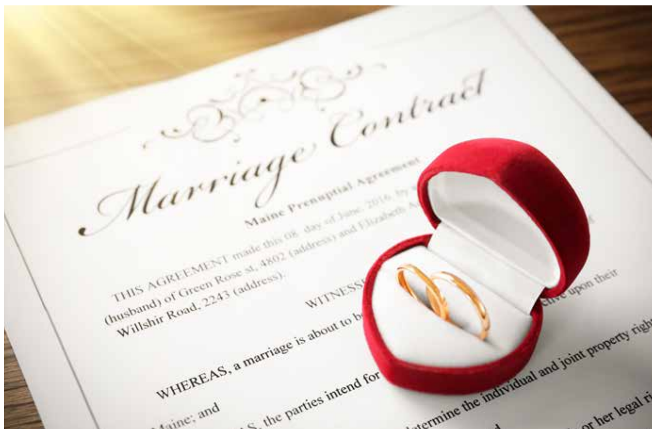
象徵承諾的結婚證書和戒指

可惜很多人已經不懂這一點了，對婚姻充滿著不切實際的幻想，最後給自己造成悲劇。英國國寶級演員費雯·麗（1913年—1967年）就是這樣一個例子。這位兩屆奧斯卡影后及威尼斯電影節最佳女主角獎得主，不但是出色的電影演員，也是優秀的舞臺劇演員。在奧斯卡頒獎禮上，評審團給她的著名評價是，「她有如此美貌，根本不必有如此演技；她有如此演技，根本不必有如此美貌。」儘管有著絕世容顏，費雯·麗在個人情感方面卻並不順遂，她沒有珍惜婚姻，而是狂熱的追求愛情，最終於53歲時在英國的家裡孤單辭世。