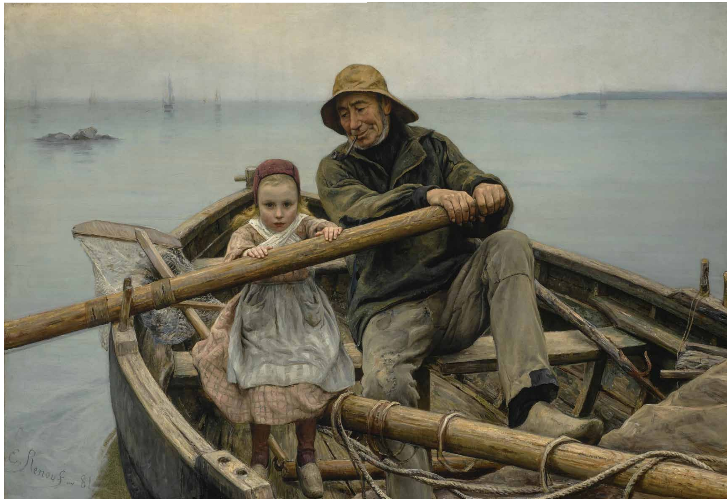
小幫手 油畫 156.8×224.8厘米 [法國] 埃米爾·雷諾 1881年