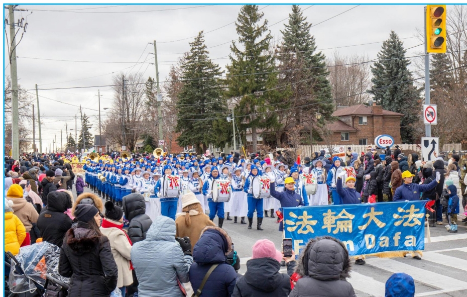
图：加拿大多伦多法轮功学员组成的天国乐团与腰鼓队应邀参加周边多个城市的圣诞节游行。