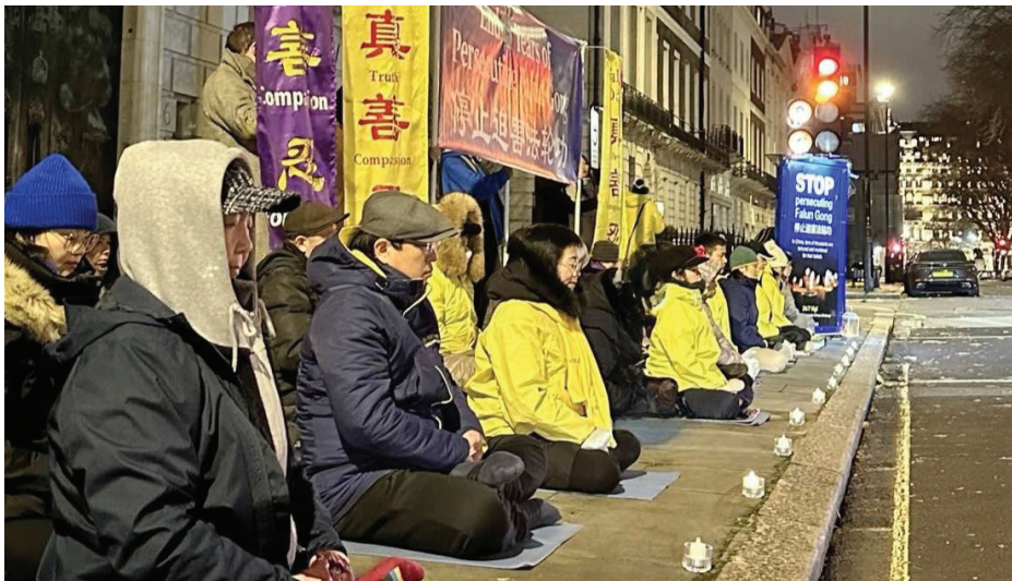
■ 英国法轮功学员国际人权日中使馆前烛光守夜。

【明慧网】每年12月10日是国际人权日，也是《世界人权宣言》的周年纪念日。2024年国际人权日的主题是“我们的权利，我们的未来，就在当下”。