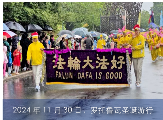
2024年11月30日，罗托鲁瓦圣诞游行