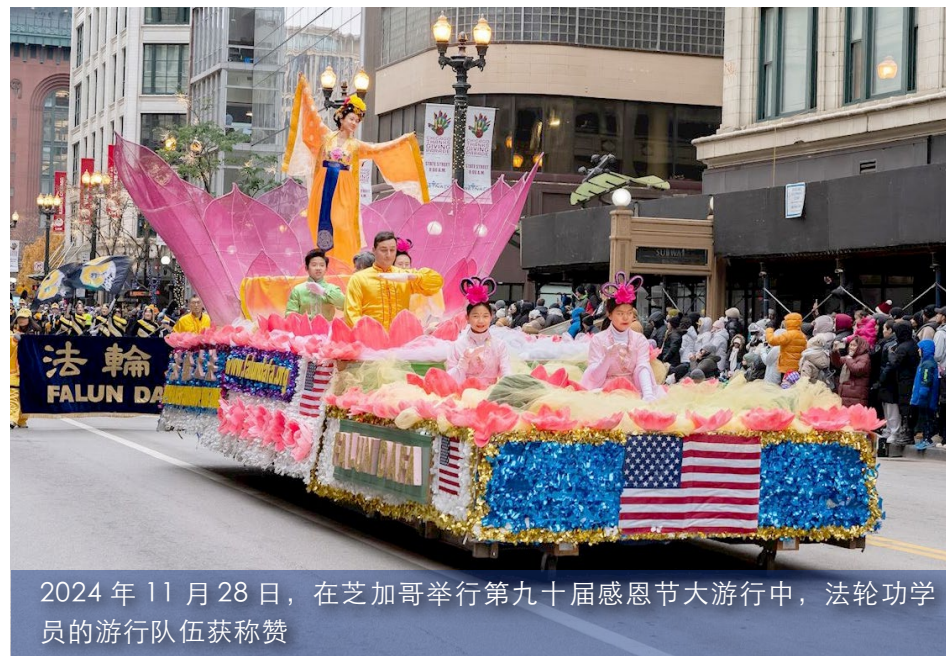
2024年11月28日，在芝加哥举行第九十届感恩节大游行中，法轮功学员的游行队伍获称赞

威廉姆斯说：“本办公室不会容忍压制言论自由的行为。今天的判决提醒我们，美国司法系统将追究那些企图在美国领土上进行恶意跨国镇压的人的责任。” ■