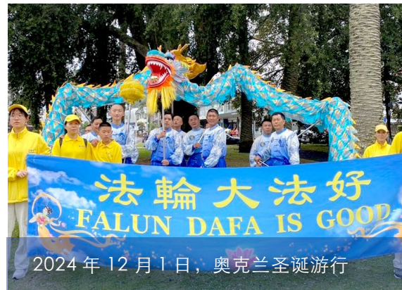
2024年12月1日，奥克兰圣诞游行