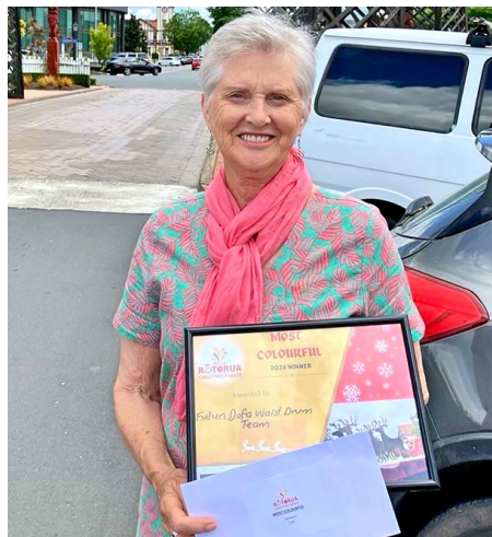
▲ 在罗托鲁瓦，法轮功团体荣获“最多姿多彩 (Most Colourful)”奖。

观看游行的观众贝特罗对天国乐团的演奏赞叹不已。同时，他们夫妻俩表示非常赞同法轮功的准则，他们认为要想拥有健康的身体，一定要先有健康的心灵。■