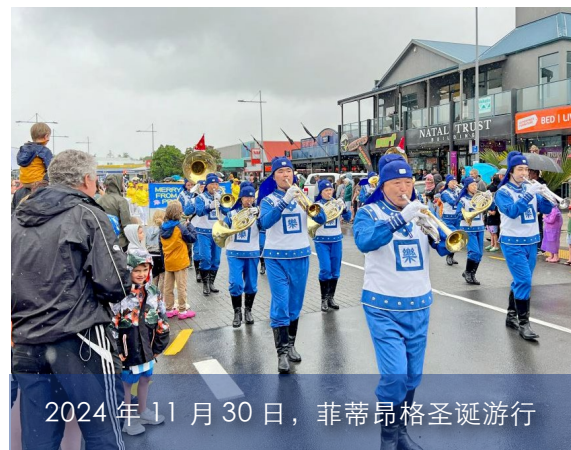
2024年11月30日，菲蒂昂格圣诞游行