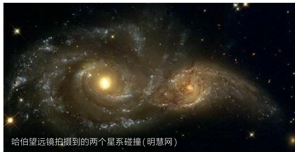
哈伯望远镜拍摄到的两个星系碰撞

当她读到这篇文章时，内心有一种寻找真相的冲动。“因为多年来我一直对这个话题感兴趣，我的内心有一种冲动，要去寻求真理。令我