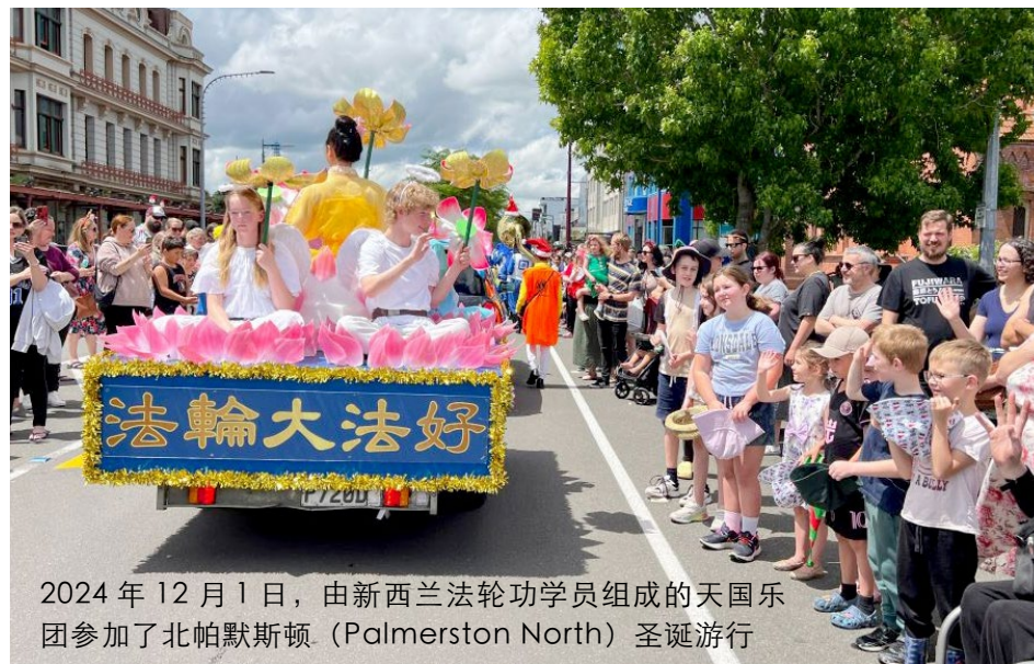
2024年12月1日，由新西兰法轮功学员组成的天国乐团参加了北帕默斯顿（Palmerston North）圣诞游行