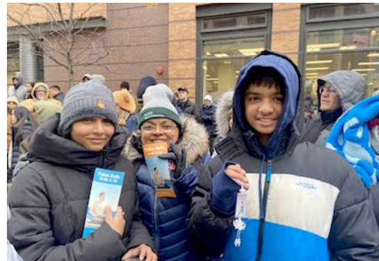
▲ 芝加哥感恩节大游行中，非常多的观众用手机拍照、记录美好的画面

喝彩和称赞。有非常多的观众用手机拍照、录影，记录美好的画面。很多观众特别感谢法轮功学员送给他们的感恩节礼物：法轮功真相小册子和小莲花，他们称赞真、善、忍是这个社会上最重要、也最需要的价值。