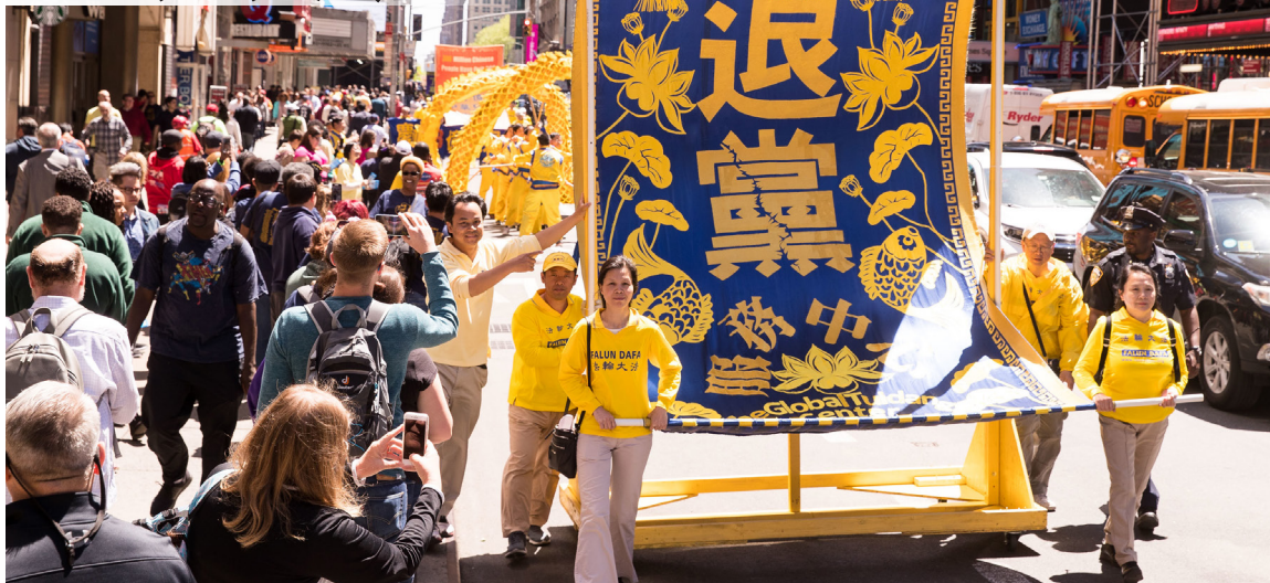
► 美国纽约曼哈顿游行中，法轮大法弟子庆祝“三退”的队伍。

在民间，自古就有“瘟疫有眼”的说法，就是说，瘟疫在哪里发生、谁会染病，冥冥之中都有定数。末劫大难将至，如何逃脱瘟疫的定向锁定？