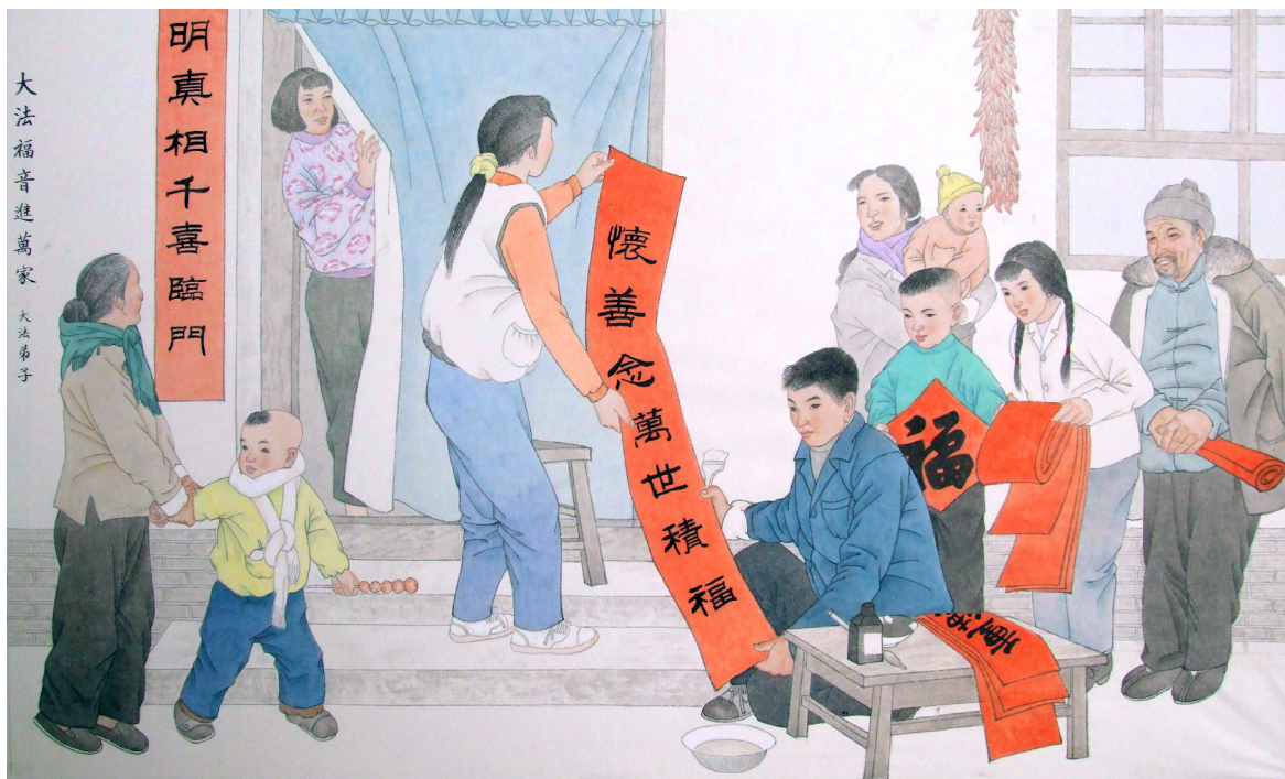
◀ 明慧网发表的大法弟子绘画作品:《明真相千喜临门》