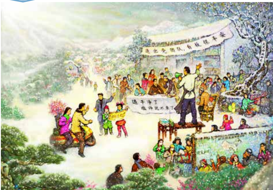
■ 绘画：《村长带领全村三退自救》。