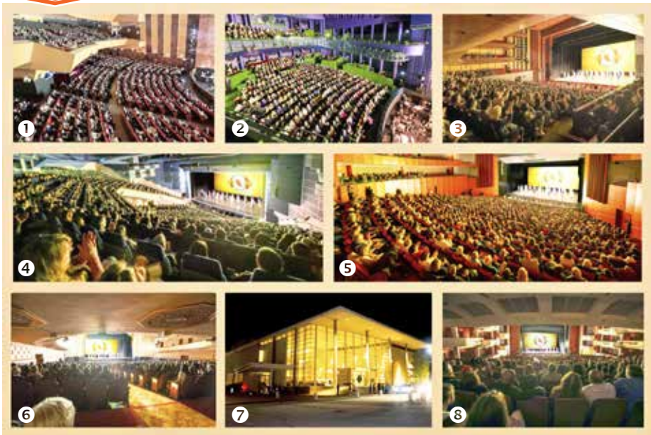
■ 二零二五年一月三日，神韵在全球八个城市同日演出，盛况空前。① 意大利卡利亚里 ② 波兰比亚韦斯托克 ③ 日本京都 ④ 英国伯明翰 ⑤ 法国普罗旺斯 ⑥ 美国旧金山 ⑦ 美国达拉斯 ⑧ 美国劳德代尔堡。