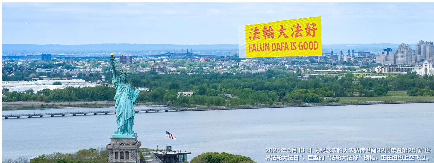
2024年5月13日，为纪念法轮大法弘传世间32周年暨第25届“世界法轮大法日”，巨型“法轮大法好”横幅，正在纽约上空飞过。