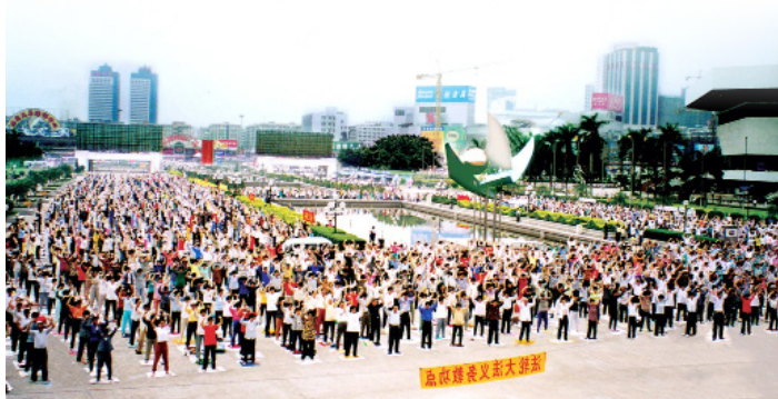
▲ 1998年广州的一个法轮功炼功点