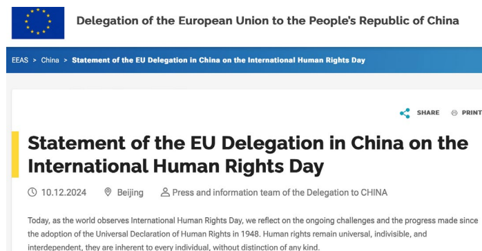
▲ 欧盟国际人权日新闻公告网路截图

泪洗面，忧伤悲痛，日夜牵挂他的生命安危。中国传统新年将至，她盼不到儿子回家团圆，最终在去年腊月二十六凄凉离世。