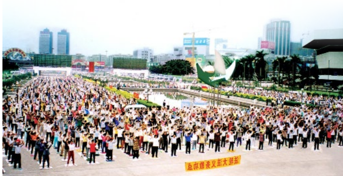
▲ 1988年广州的一个法轮功炼功点