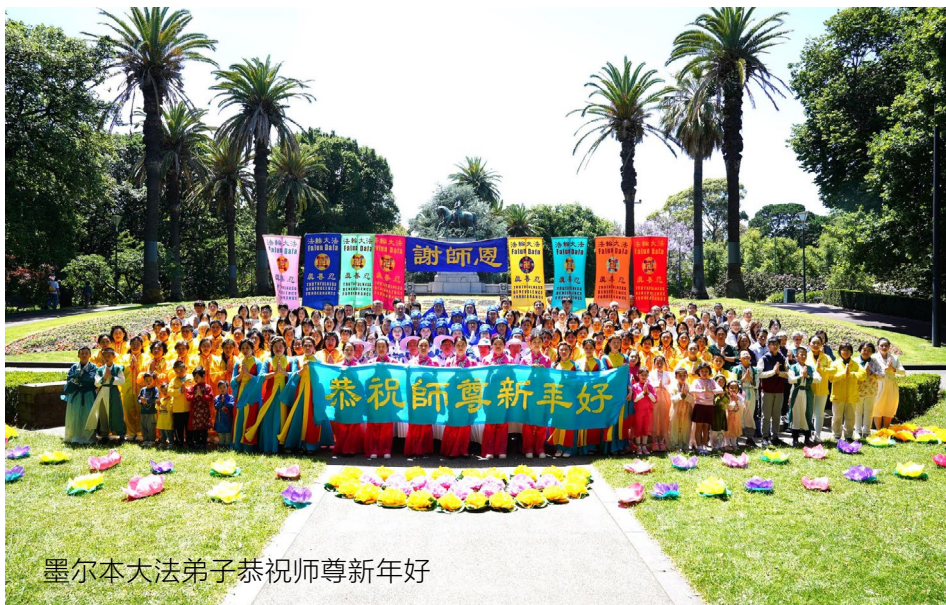
墨尔本大法弟子恭祝师尊新年好