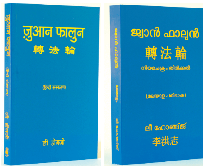
■ 印地语《转法轮》和马拉雅拉姆语《转法轮》