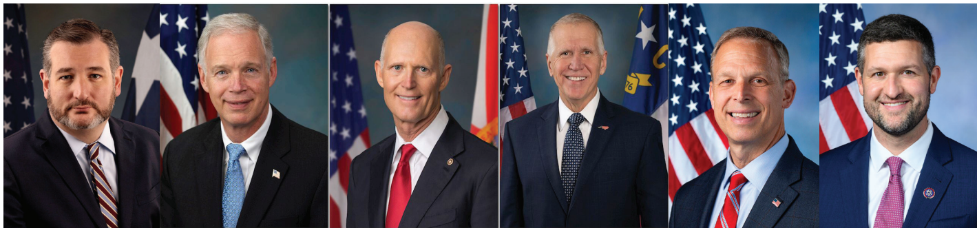
泰德·克鲁兹 | 罗恩·约翰逊 | 里克·斯科特 | 汤姆·蒂利斯 | 斯科特·佩里 | 派特·瑞安

【明慧网】2025年3月3日，美国国会参议员泰德·克鲁兹在参议院提出“法轮功保护法案”，指出中共仍在参与对法轮功学员的活摘器官暴行。该法案将对那些参与强摘器官的个人或共谋实施制裁，对中共追责，并要求美国国务卿向国会报告中共器官移植的政策和操作。