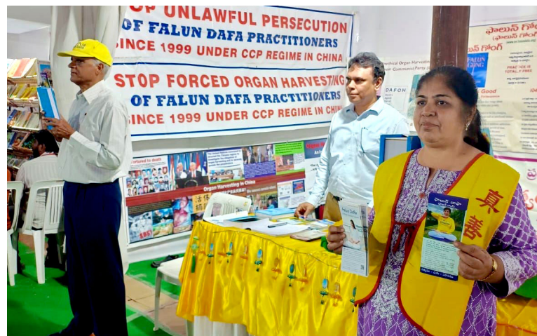
▲ 在海得拉巴 NTR 体育场举行的第三十七届海得拉巴书展上的法轮大法展位

学员们还展出了“真、善、忍国际美展”的几幅画作，这些作品是法轮功学员艺术家们的作品，描绘了修炼法轮大法的美好以及中共迫害法轮功学员的残酷现实。他们还征集签名，谴责前中共党魁江泽民对法轮功学员发动并持续了长达二十五年的迫害。