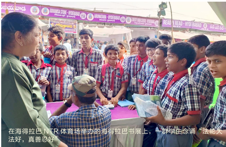
在海得拉巴 NTR 体育场举办的海得拉巴书展上，一群学生念诵“法轮大法好，真善忍好”