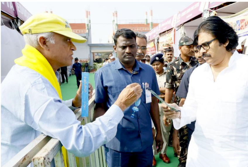
▲ 在印度 IGMC 体育场举行的第三十五届维杰亚瓦达图书节上，法轮功学员（左）把真相资料递给安得拉邦副部长帕万·卡廷（右）

2025年1月2日至9日，当地法轮功学员参加了由维杰亚瓦达图书节协会（VBFS）主办的维杰亚瓦达图书节。图书节在英迪拉·甘地市政体育场举行，吸引了超过