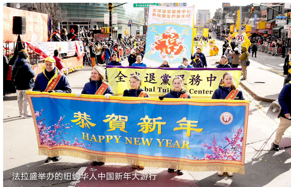
法拉盛举办的纽约华人中国新年大游行