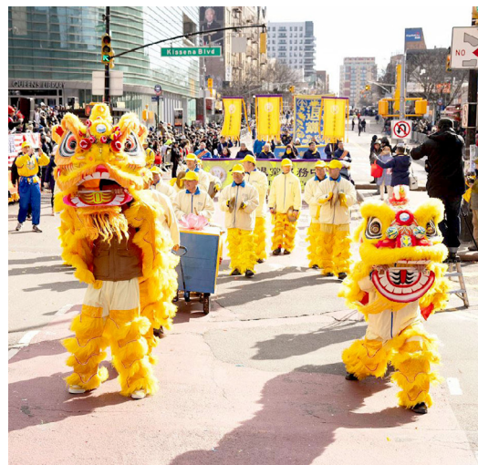
▲ 法拉盛举办的纽约华人中国新年大游行，法轮功学员队伍声势浩大

建祝福法轮功学员们都身体健康，开开心心过一个祥和的新年。“我相信我们会一起见证中共倒台灭亡的明天。”