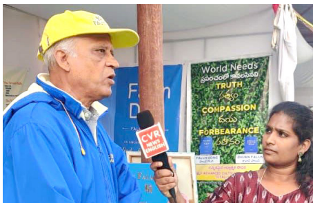
▲ 法轮功学员（左）接受 CVR 英文新闻频道采访

在书展上，法轮大法展位也引起了新闻媒体的关注。CVR English News、Politikos等频道在展位前采访了学员。来自各行各业的民众参观了法轮功学员的展位，他们都赞赏法轮大法真、善、忍原则所倡导的生活方式。