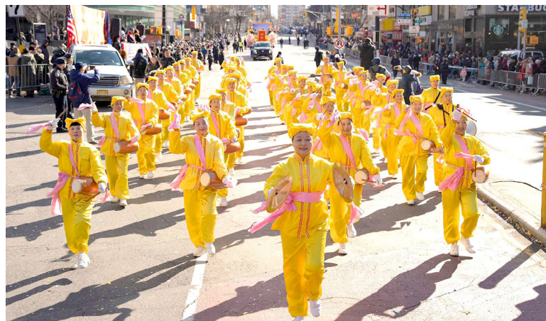
▲ 部分全球退党义工组成的队伍