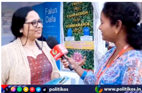
▲ 法轮功学员（左）接受 Politikos 媒体记者（右）采访