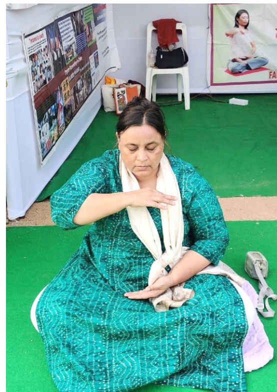
▲ 法轮功学员在展位前炼第五套功法

在展位上，法轮功学员们还向参观者介绍了正在进行的法轮大法网上弘法教功班的相关信息，这些网上教功班提供多种印度语言，包括印地语、马拉地语、卡纳