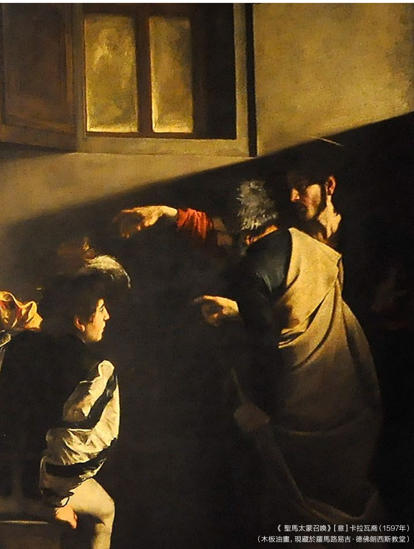
《聖馬太蒙召喚》[意]卡拉瓦喬(1597年) (木板油畫, 現藏於羅馬路易吉·德佛朗西斯教堂)