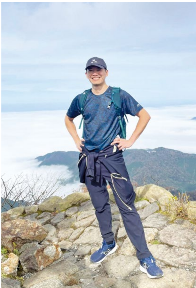
兆均表示，修煉後的自己就像重生一樣！