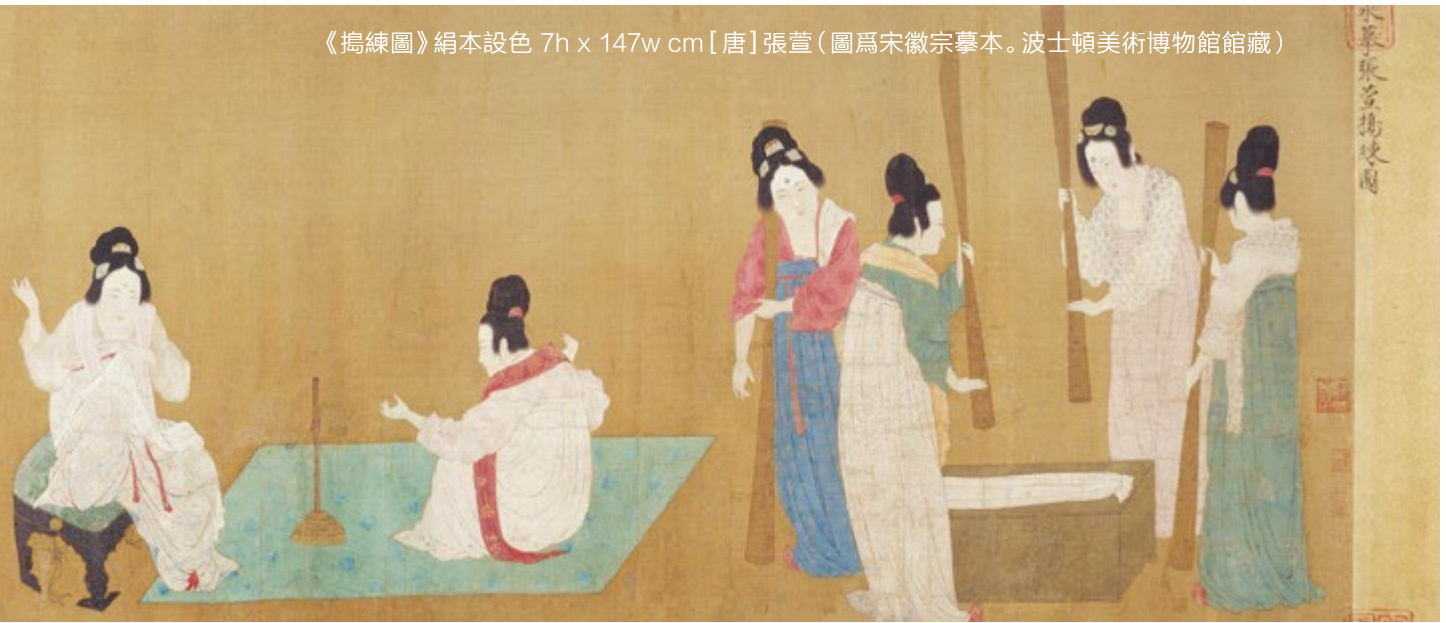
《搗練圖》絹本設色 7h x 147w cm [唐]張萱 (圖為宋徽宗摹本。波士頓美術博物館館藏)