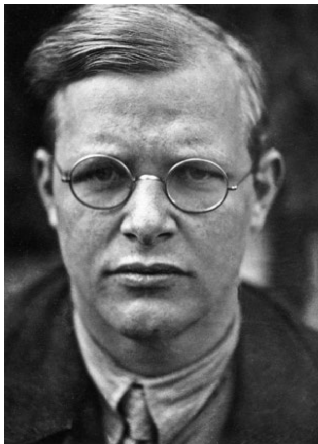
迪特里希·朋霍費爾 (Dietrich Bonhoeffer)

朋霍費爾於1906年2月4日出生於德國布雷斯勞（今波蘭弗羅茨瓦夫）的一個知識分子家庭。他的父親卡爾·朋霍費爾（Karl Bonhoeffer）是一位著名的精神