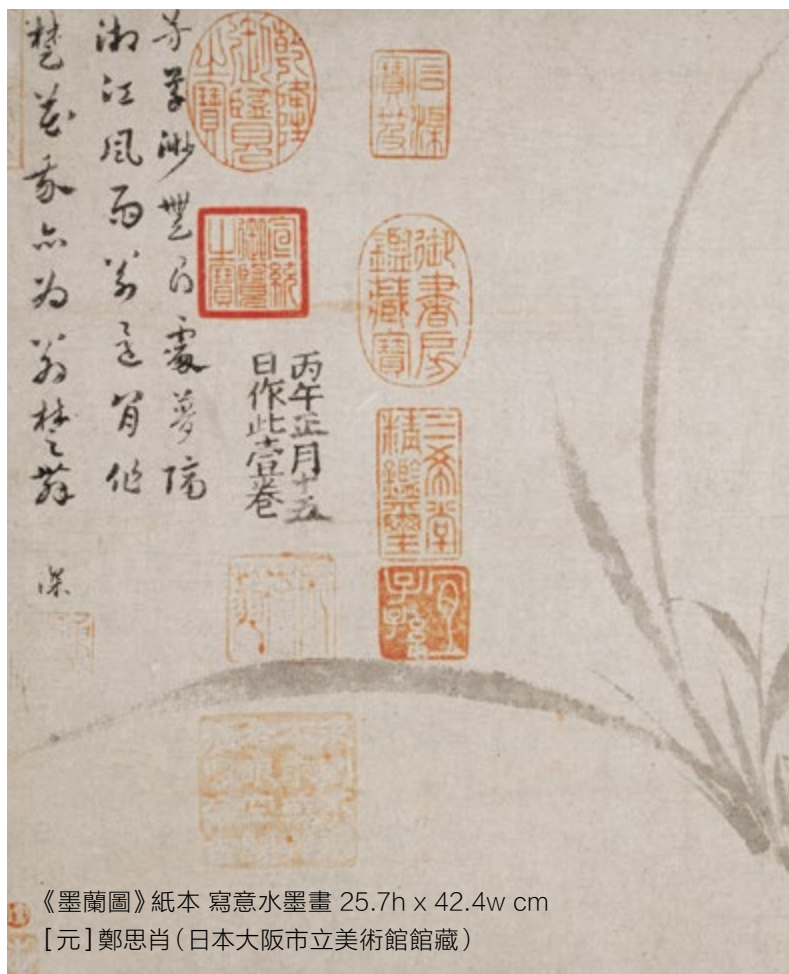
《墨蘭圖》紙本 寫意水墨畫 25.7h x 42.4w cm [元] 鄭思肖 (日本大阪市立美術館館藏)

現代媒體常喜歡追捧，哪個名人開哪個名牌跑車，誰家的豪宅有多華麗，哪個人的婚禮有多奢華。相反地，中國歷史上，不論哪個朝代都提倡節省、儉樸。是因為古代比現代物資缺乏，所以不得不提倡節儉嗎？下面，我們探討古人對節儉與奢侈的看法，以及儉與奢的後果。