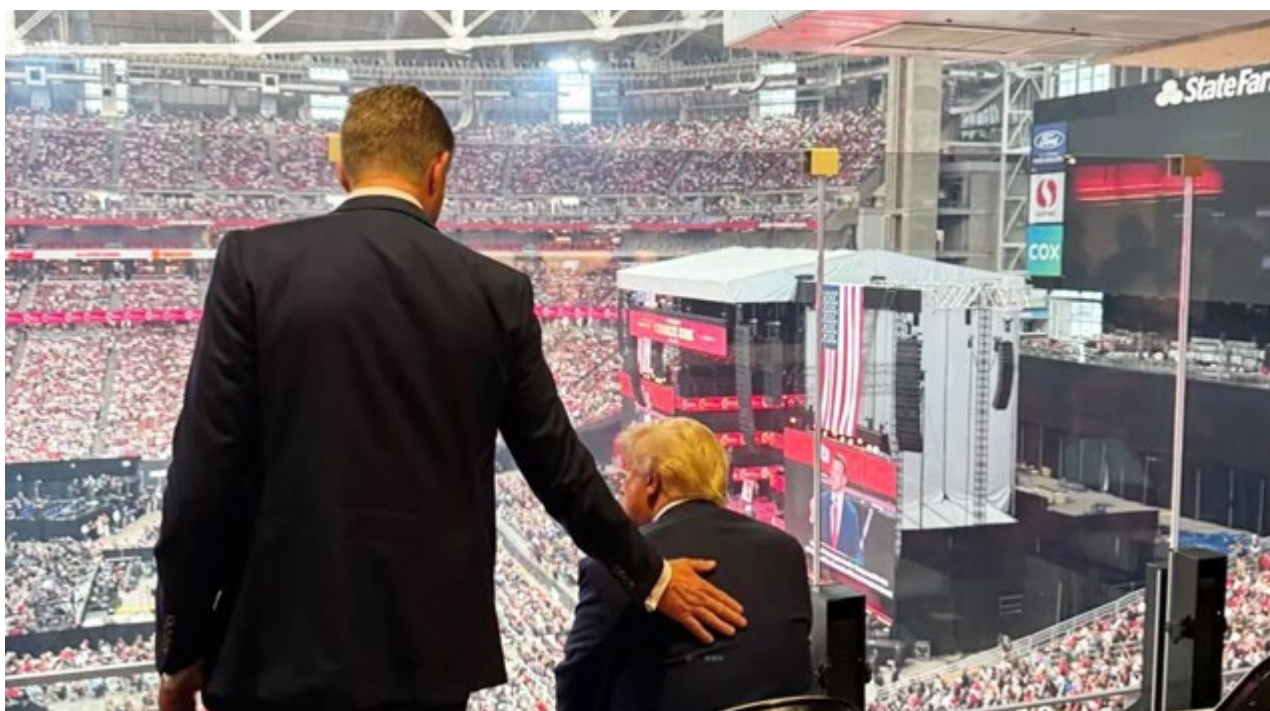
2025年9月21日星期日，逾十萬民衆參加了「美國轉折點」在亞利桑那州一個能容納約6萬3千人的體育場舉辦的查理·柯克追悼會。美國總統、副總統，國務卿、戰爭部長、衛生健康部長等內閣成員、以及衆多國會議員和參議員前往出席並講話。圖爲川普總統的二兒子埃里克·川普安撫悲傷的老父親。

祝柯克遇害的雇員停職或開除。熱愛傳統的美國公眾普遍認為，你可以不認同另一個人的觀點，但不能因觀點不同就對人暴力消滅。因他人被謀殺而幸災樂禍，甚至抹黑逝者，藉機散布仇恨，是缺乏人性和道德嚴重迷失的體現。