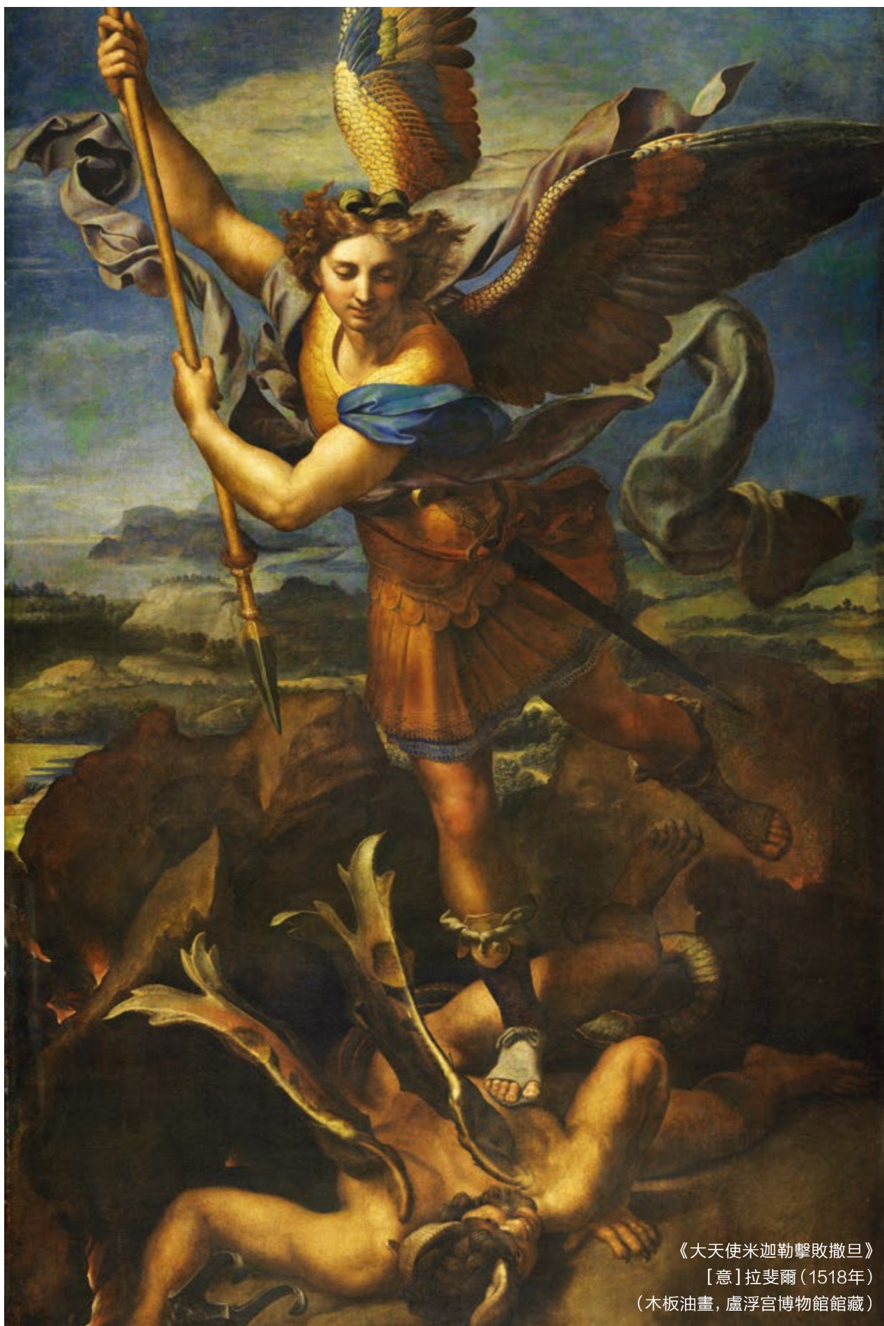
《大天使米迦勒擊敗撒旦》 [意]拉斐爾(1518年) (木板油畫, 盧浮宮博物館館藏)