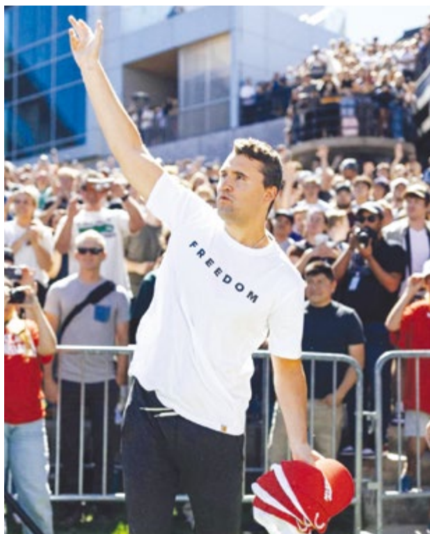
查理·柯克，2025年9月10日在美國猶他谷大學與大學生等聽眾互動。

刺殺事件發生之日，時值2025年剛剛開始的「美國回歸巡迴辯論」的第一站，帳篷上的大字橫幅赫然寫道：「來證明我錯了」(Prove Me Wrong)。和平時一樣，查理坐在帳篷內，面前放著話筒，帳篷前為前來提問或挑戰的人也準備了話筒。當天的現場視頻顯示，查理身穿胸前印有「自由」(Freedom)一詞的白色T恤。他先友好地問候到場的大約3,000名學生，再向熱情的觀眾拋遞了一些棒球帽，然後用了二十分鐘與第一位挑戰者互動。