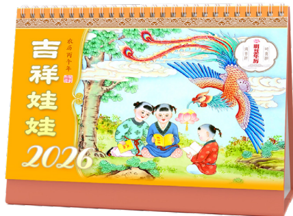
▲ 明慧2026年《吉祥娃娃》台历

还有一次，我去赶集，遇到一位70多岁的老太太。她眼睛炯炯有神，长得非常富态。我对她说：“在您庄头遇到，真是缘分啊，