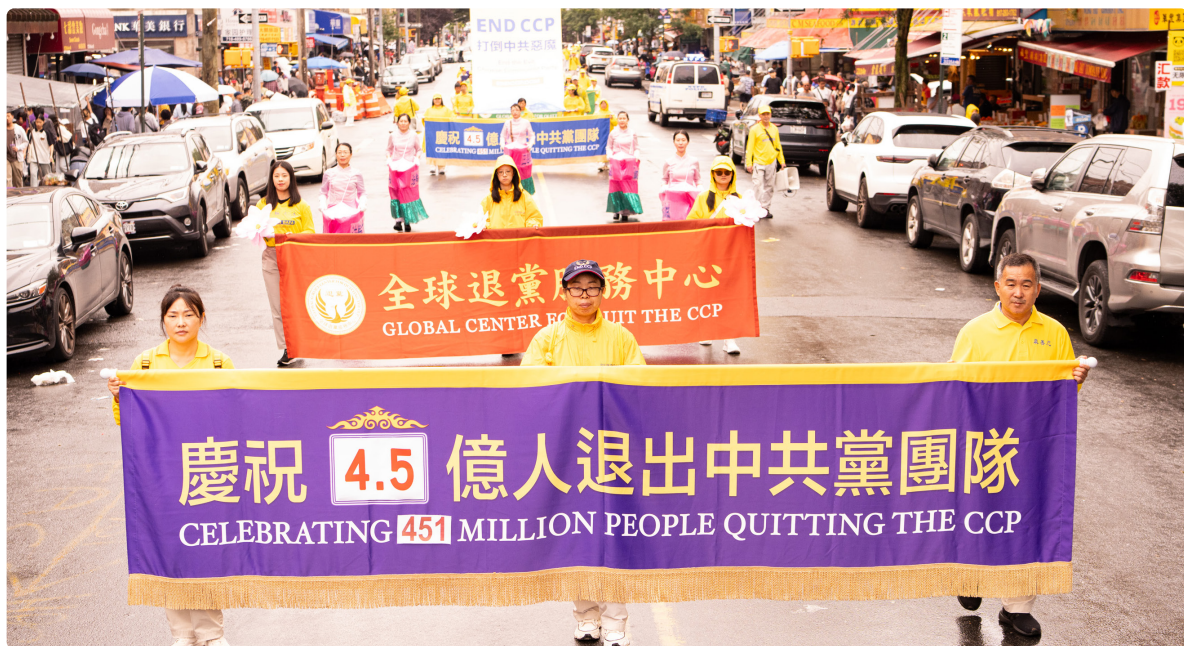
◀ 2025年9月7日，法轮功学员在纽约布鲁克林大游行，声援4.5亿中国人退出中共党、团、队组织。