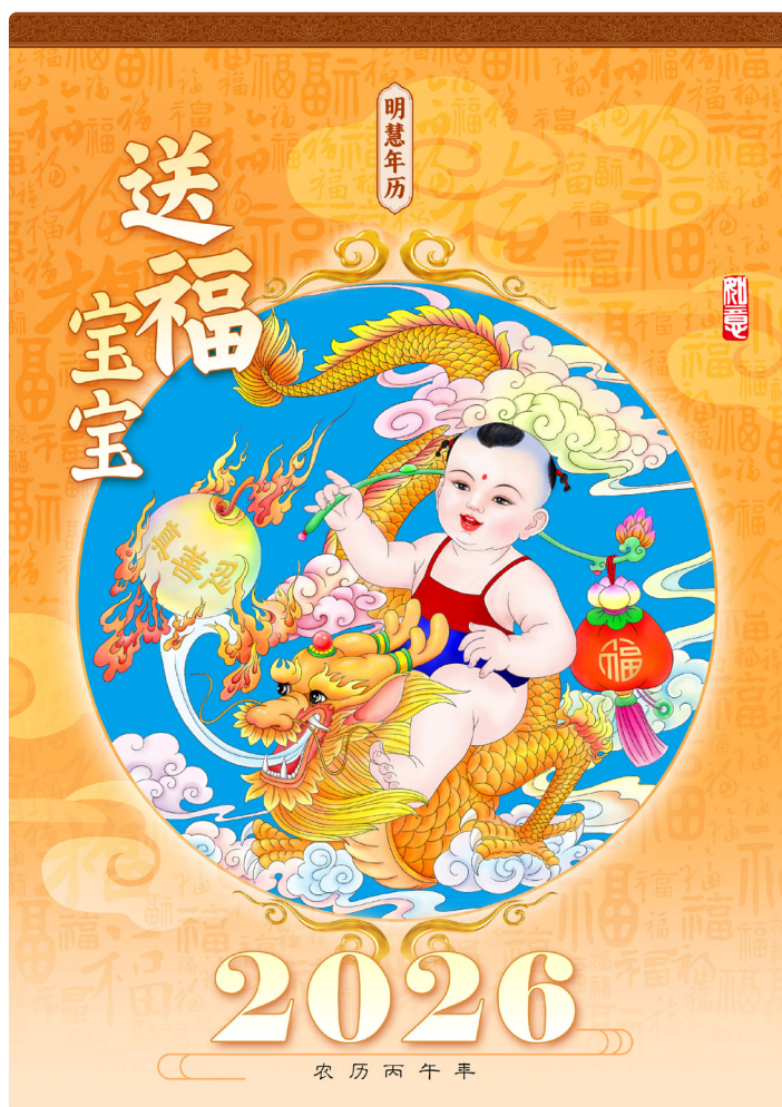
▲ 明慧2026年《送福宝宝》挂历

不理解的地方问女儿,女儿说:“就像你上学,遇到不会的题先放下,继续往下学,慢慢就会了。《转法轮》讲的是宇宙大法,越学理解得越多。”我觉得女儿说得有道理,就决定修炼大法了!