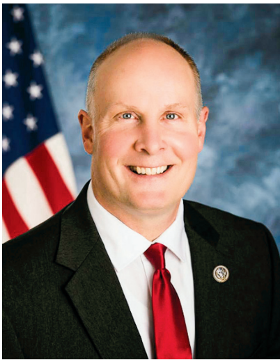
■ 美國密西根州聯邦眾議員約翰·穆勒納爾。

據美聯社近期報導，「美聯社查閱的一份思科公司二零零八年的演示文稿顯示，其產品能夠識別網絡上超過90%的法輪功