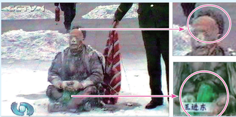
↑ 王進東「自焚」穿幫鏡頭