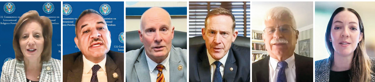
■（左至右為）USCIRF 主席及副主席哈茨勒與馬哈茂德、聯邦眾議員穆勒納爾與巴特、美國前助理國務卿德斯特羅，以及自由之家總裁博雅吉安。

人、家庭教會和地下天主教徒，並指出，中共殘酷無情地迫害法輪功團體，目的是企圖鏟除他們。