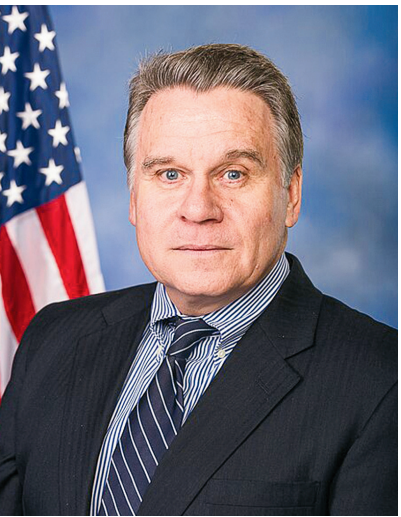
■ 美國新澤西州聯邦眾議員克里斯·史密斯。

史密斯和穆勒納爾議員正在請求美國副檢察長敦促最高法院駁回思科公司在案件中提出的調卷令申請（petition for a writ