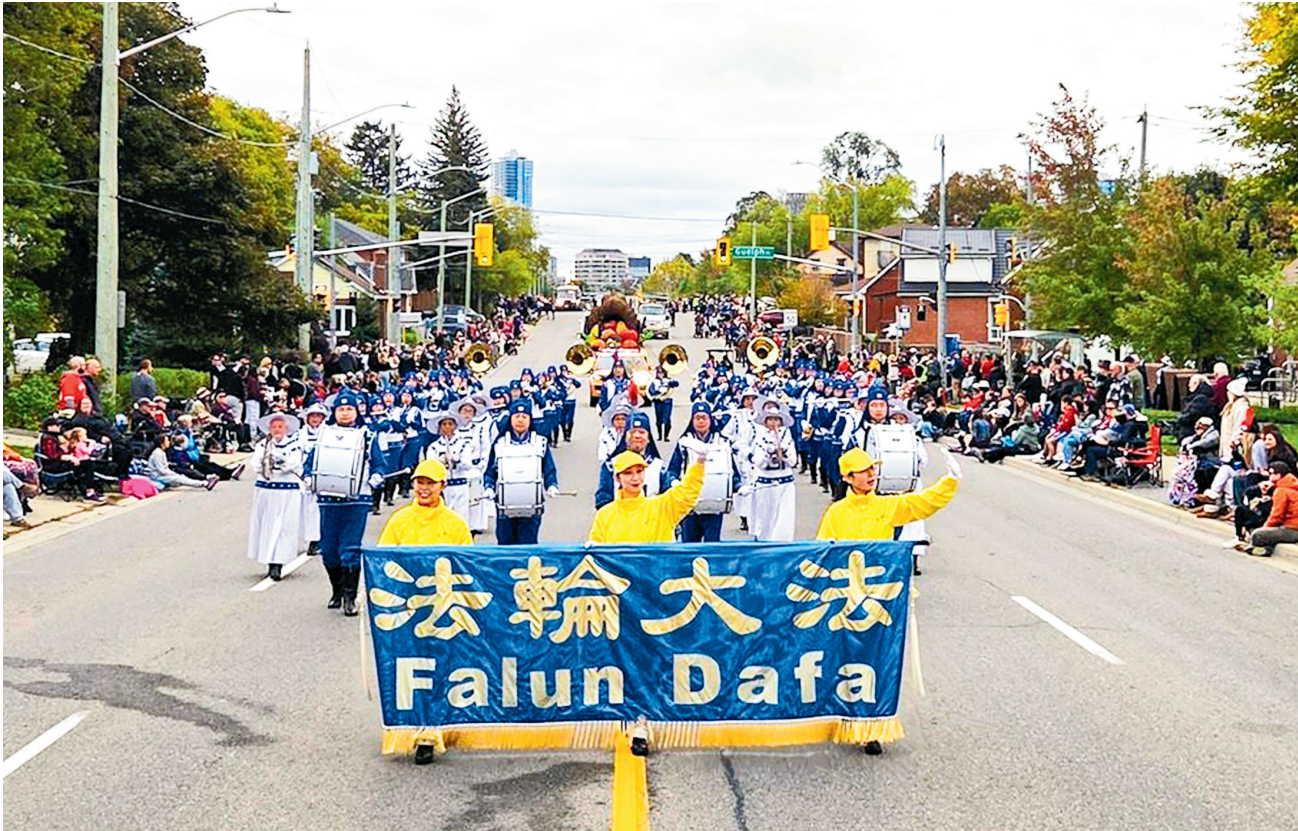
■二零二五年十月十三日，加拿大多倫多法輪功學員組成的天國樂團應邀參加了基奇納 - 滑鐵盧慕尼黑啤酒節感恩節遊行。

天國樂團再一次作為壓軸節目出場，金秋十月的陽光更顯法輪大法「真、善、忍」法鼓法號樂音祥和。樂團排練時，已有路人為他們拍照、錄像；還有華人表示很喜歡樂團成員的傳統服飾。