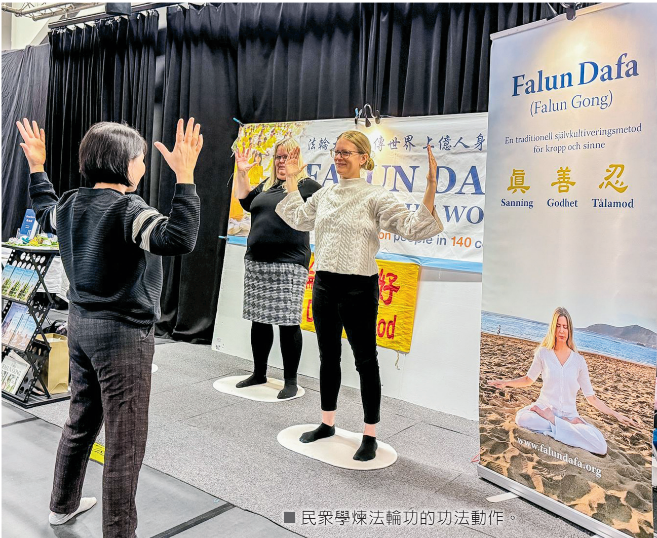
■ 民眾學煉法輪功的功法動作。

似地照射下來，圍著那個煉功的場地，很壯觀。我很好奇就走上前想看個究竟。」沒想到那道陽光也落在了她的胳膊上，讓她感覺很舒服。