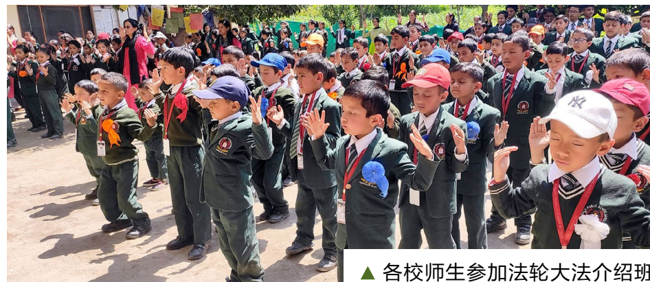
▲ 各校师生参加法轮大法介绍班

生了浓厚兴趣。这样的活动不仅拓展了学生的眼界，也促进了他们的综合素质发展。我们期待未来能继续合作。”