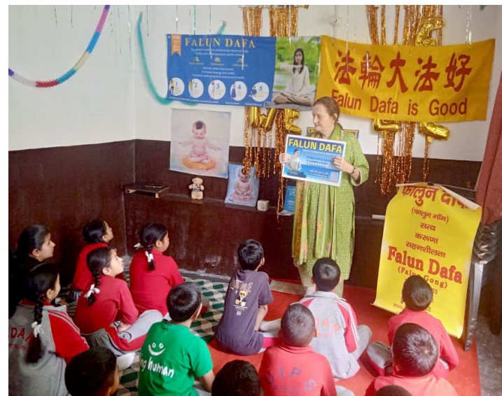
▲ 法轮功学员向师生介绍法轮功并免费教授功法

老师们表示，法轮大法所倡导的价值观能够帮助学生提升专注力、树立正确的道德观。炼功后，不少学生分享说自己感到身心放松、内心平静、精神愉悦。