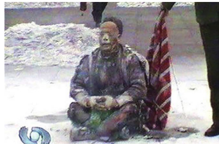
▲ 2001年1月23日，大年除夕，中共炮制了一场以污蔑法轮功为目的“天安门自焚”伪案

许多人因此看清了中共的邪恶，选择退出中共“党团队”；也有人仍被谎言蒙蔽，不愿面对现实。