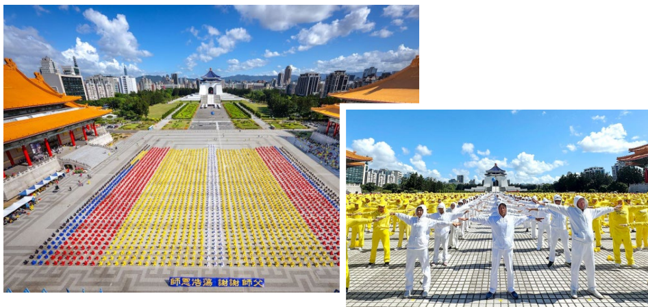
▲ 左图为法轮功学员以“师恩浩荡 谢谢师父”横幅向李洪志师父表达敬意；右图为 5,000 名法轮功学员于排字结束后，举行集体炼功