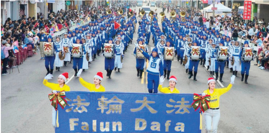
台湾法轮大法天国乐团受邀参加今年的台湾嘉义市“国际管乐节”嘉年华。

【明慧网】节日游行是世界各地人们喜闻乐见的庆祝活动。二十年来，一个身穿蓝白相间、古典唐朝乐官服饰的军乐团广受观众喜爱，他们是2005年底在纽约率先成立的天国乐团。由法轮功学员组成的天国乐团目前已遍及美国、加拿大、澳大利亚、台湾、欧洲等二十多个国家，为人们送去节日祝福与真善忍的美好。