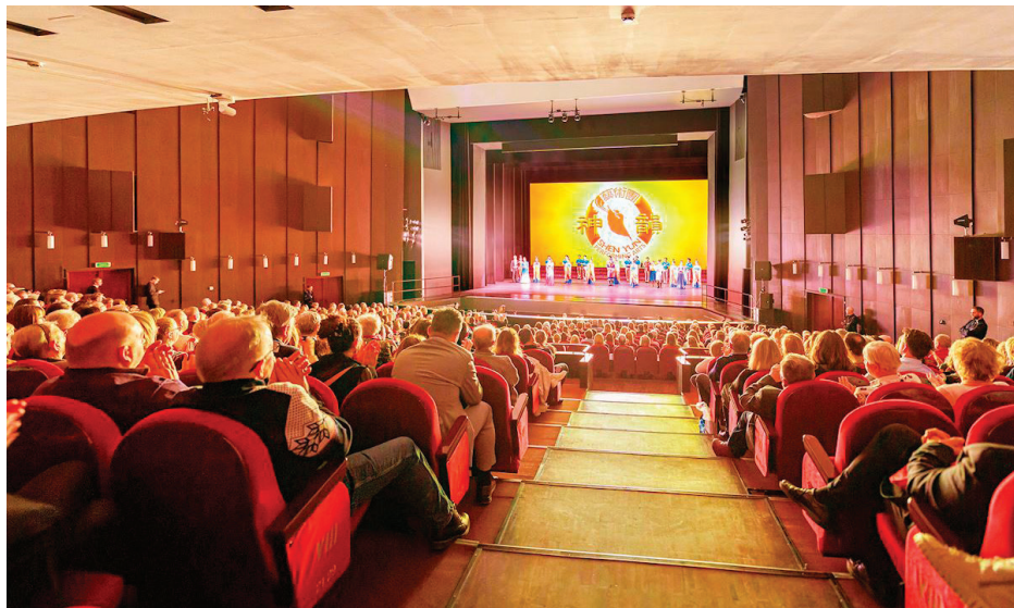
▲ 1 月 10 日，神韵巡回艺术团在波兰罗兹大剧院演出，票房均已提前售罄。

【明慧网】在刚刚过去的一周，神韵同等规模的艺术团同步在美国、法国、英国、波兰和意大利的共 11 个城市上演了 36 场演出，多城一票难求。神韵纯善纯美的演出，传递善的讯息，展现信仰与人性光辉，充满救赎的力量，令各国精英深感共鸣——是一场“关系到你人生的秀”。