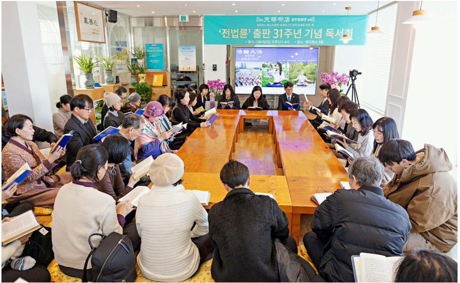
图：韩国首尔天梯书店二零二六年一月四日举办了纪念《转法轮》出版三十一周年纪念活动，五十余名学员齐声朗读《转法轮》，并分享了自己修炼后人生发生的变化。