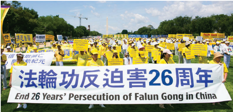
▲ 2025 年 7 月 17 日，部份美国法轮功学员在美国首都举办反迫害集会。

【明慧网】2026 年 1 月 20 日，有关方面通报，中共国家安全部原副部长、中央 610 办公室原副主任高以忱，因涉嫌严重违纪违法，已被取消相关待遇，其涉嫌犯罪问题及相关财物已移送检察机关依法审查起诉。高以忱被起诉实质是因为迫害法轮功遭了恶报。