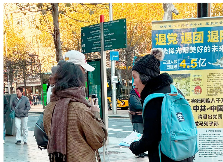
◀ 华人在都柏林市中心真相点了解真相

说完后，他就加快脚步，撵上前面旅行团里的其他游客，语气轻快又响亮地说，“他们劝我退党，我退党了！”