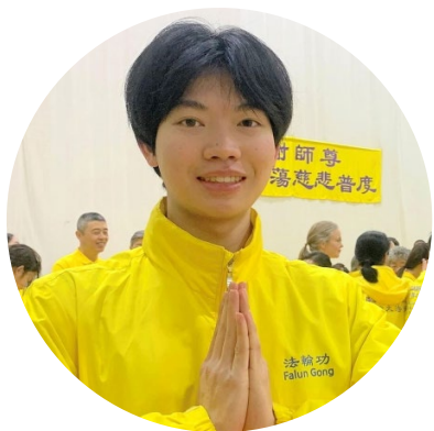
▲ 大二学生小严向师父表达感恩

她说：“以前生气时难以摆脱消极念头，但修炼后，我能直视根源并让它消失，心态因此更加平和、开阔。”