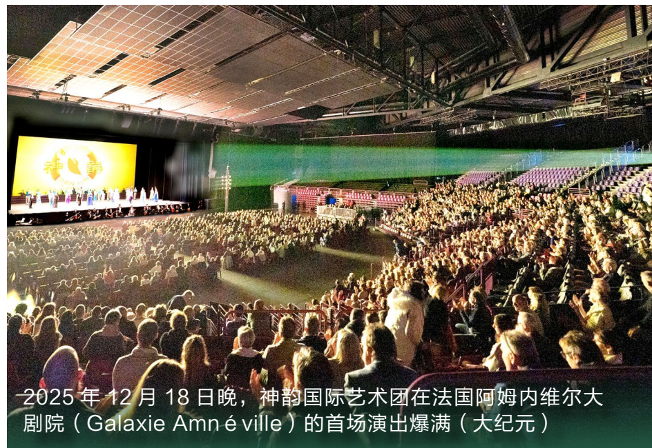
2025 年 12 月 18 日晚，神韵国际艺术团在法国阿姆内维尔大剧院（Galaxie Amnéville）的首场演出爆满