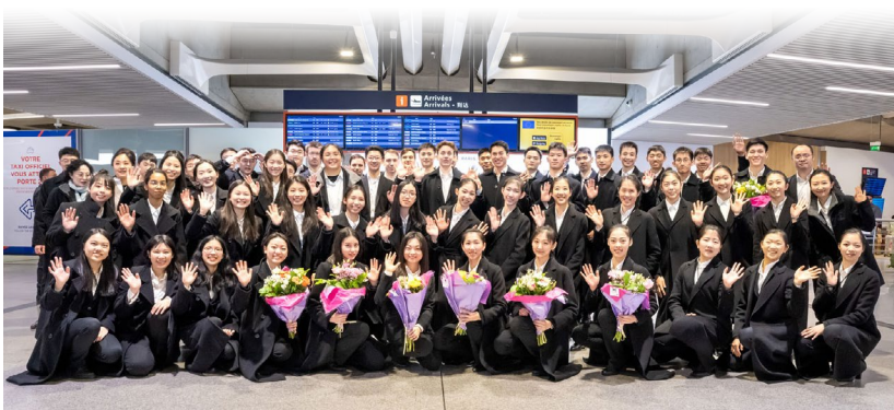
▲ 美国神韵国际艺术团抵达巴黎戴高乐机场，即将开启神韵2026演季全球巡回演出

2026演季神韵全球巡回演出详情，请访问： https://shenyun.org/ 。■