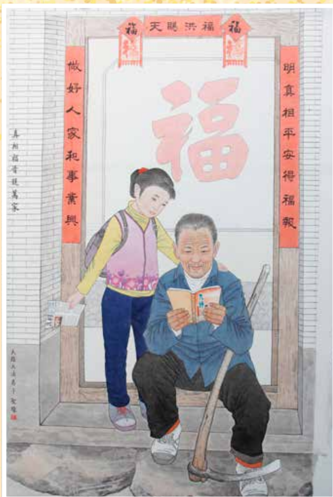
■ 绘画：得真相。作者：河北大法弟子