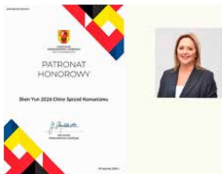
■ 罗兹省长斯克兹德鲁斯卡女士褒奖神韵艺术团。

就展现了中国文化。所以我一定会认真阅读这本书，以了解更多信息，并深入了解这些故事的背景。”