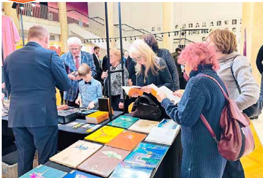
■ 神韵在波兰罗兹大剧院上演期间，法轮大法书籍热销。