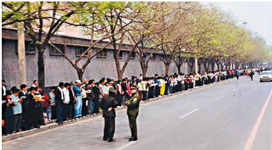
■ 逾万名法轮功学员到北京和平上访历史图片。

作为迫害元凶，江泽民死后已经坠入无间地狱，遭受永无休止的地狱刑罚，以偿还其迫害佛法犯下的滔天罪恶。🌀