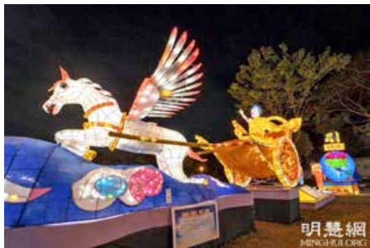
■ 法轮功学员制作的《神驹天车》参加台湾元宵灯会。

汉明帝时，明帝为了弘扬佛法，下令正月十五夜，不论士族庶民，一律“燃灯敬佛”，以示对神佛的尊敬和虔诚。此后，正月十五夜燃灯的习俗随着佛、道文化的影响扩大逐渐在中国扩展开来，历朝历代都以此为一大盛事。