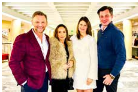
■ 波兰资深管理专家奥索维茨夫妇(右一、右二)及友人。