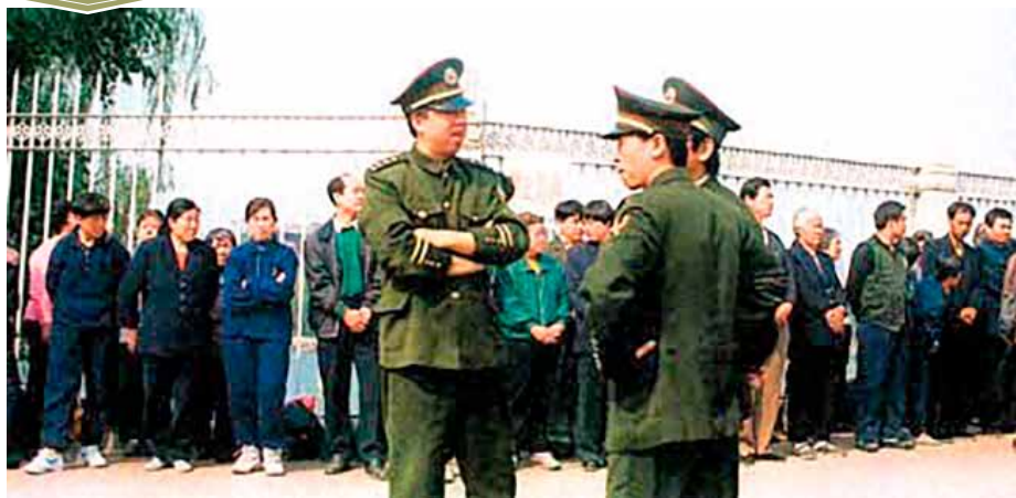
■ 逾万名法轮功学员到北京和平上访历史图片。