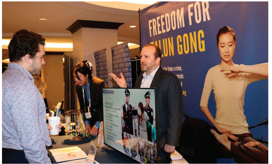
▲2月2日，在国际宗教自由峰会上，与会者在法轮功真相展位前了解真相。

2月4日，在美国国会举行的听证会上，国际宗教自由峰会共同主席萨姆·布朗巴克指出，中共正动用巨额资金与高科技监控，对包括法轮功在内的多个信仰群体展开系统性迫害，他说美国政府应更加公开、明确地声援遭专制政权