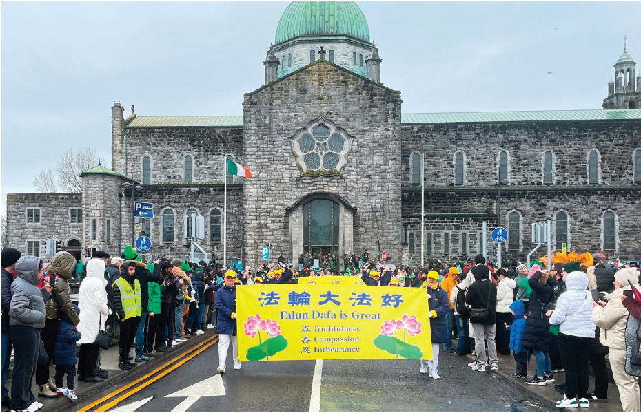
▲ 3月17日, 爱尔兰法轮大法学会参加高威古城国庆节大游行。

★ 2026年3月25日至4月12日, 美国神韵艺术团将重返纽约市大卫·寇克剧院, 为世界之都的观众献上18场演出。纽约州包括联邦国会议员、州参众议员及多个县市镇的近70位政要, 纷纷颁授褒奖令并致贺信, 祝神韵在纽约的演出圆满成功。政要们对神韵艺术团20年来享誉世界的辉煌成就和独特贡献倍加推崇, 由衷赞叹神韵20载艺韵流芳, 赞颂神韵艺术总监D.F.先生与艺术家们以底蕴深厚、纯善纯美的精湛技艺和恢弘绚丽的舞台艺术弘扬传统价值、丰富社区文化, 为全球观众带来美好与希望。