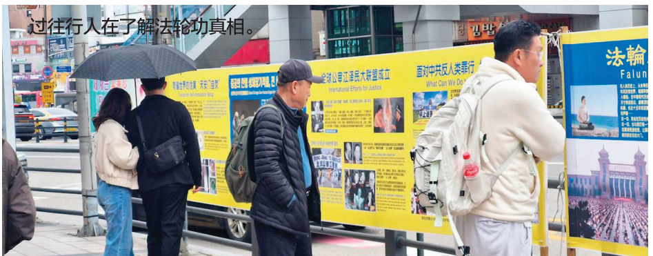
过往行人在了解法轮功真相。

下一个周末，水原站出口的那一抹身影依然会准时出现。这不仅是一段已经走过的历史，更是一份正在书写的、关于正义与勇气的时代传奇。